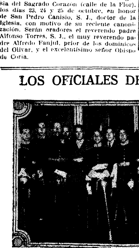
El Rey imponiendo las fajas a los nuevos capitanes