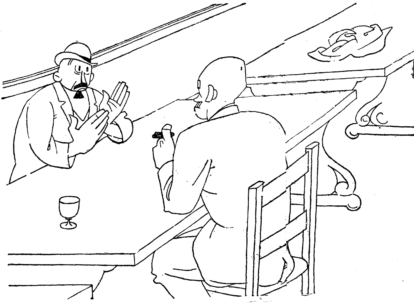
—¿De modo que al Congreso de Pesca? —Sí, señor. Pero antes voy a pedir una caña.