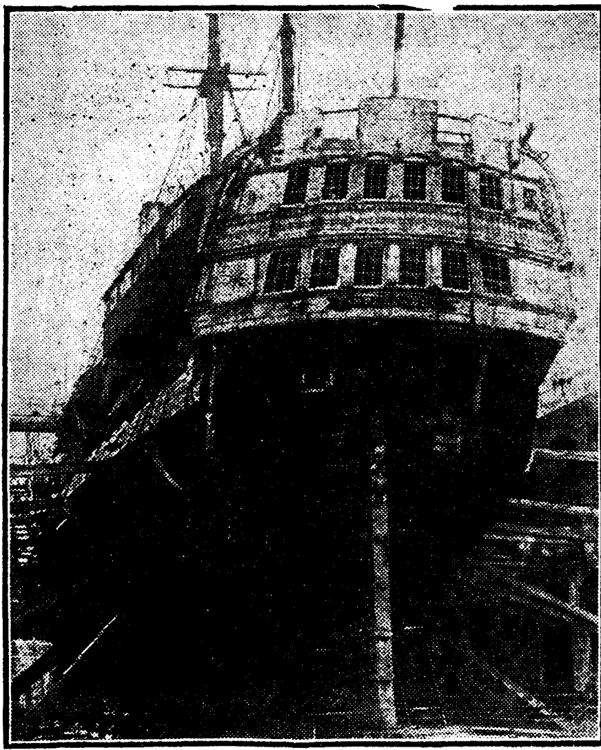
El navio británico «Improbable», que intervino en el combate de Trafalgar, y para cuya reparación se hará una colecta en Inglaterra