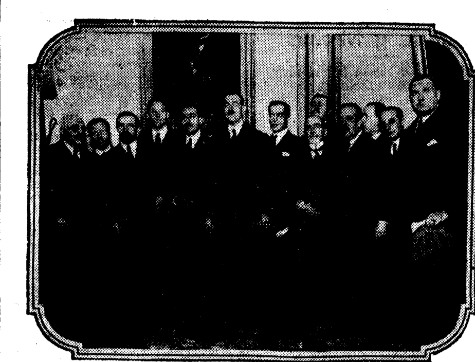
Presidencia de la sesión preparatoria