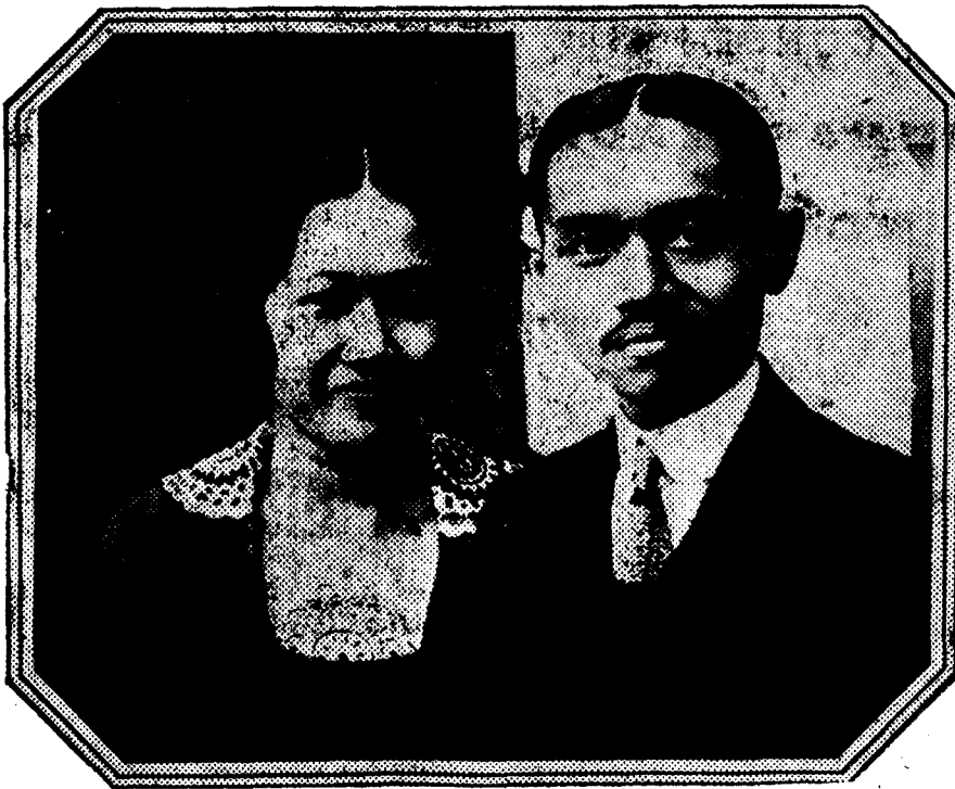
El nuevo rey de Siam, Prajatipok, y su esposa Rhambhal