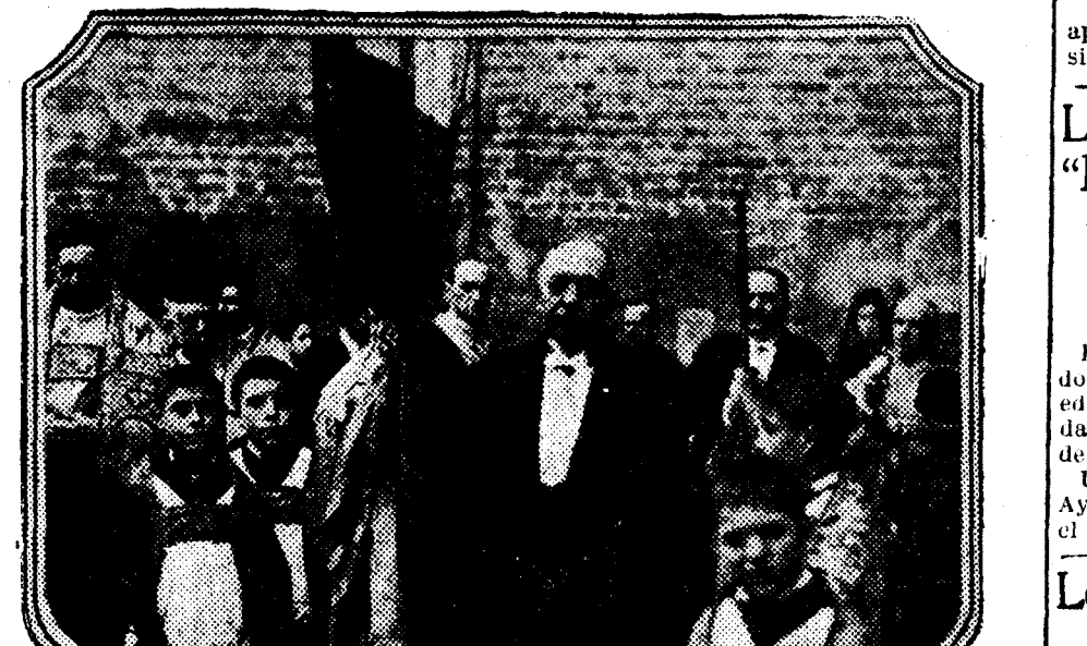
Procesión cívica para conmemorar la toma de Sevilla por San Fernando. El síndico de la ciudad lleva el estandarte que cubaba a las huertas cristianas, y el gobernador civil, la espada del Santo.