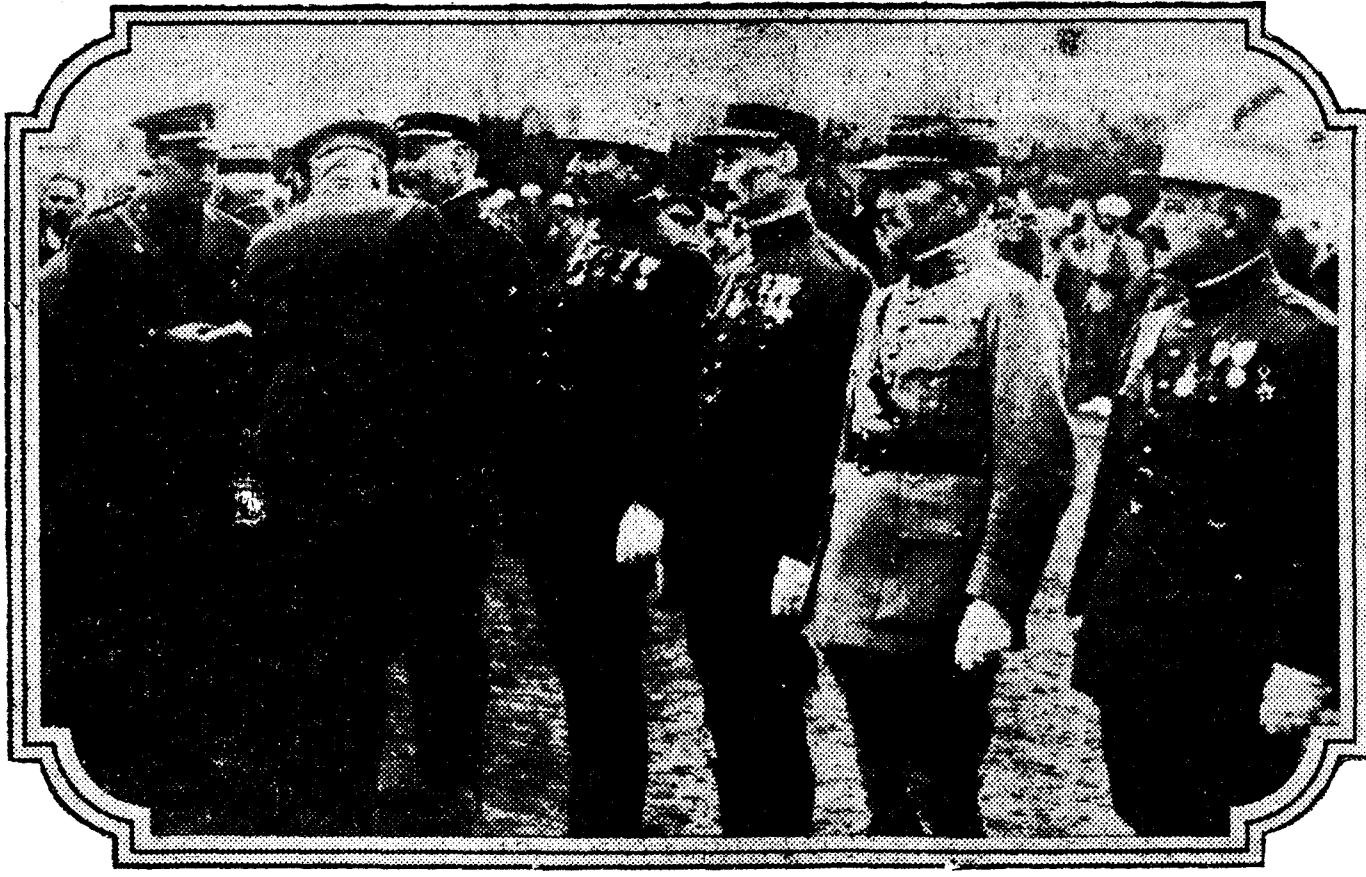
El general Primo de Rivera imponiendo las condecoraciones concedidas por el Gobierno español al general Nauhin y a los jefes y oficiales del Ejército francés por su actuación en las operaciones francoespañolas de los límites de las dos zonas.