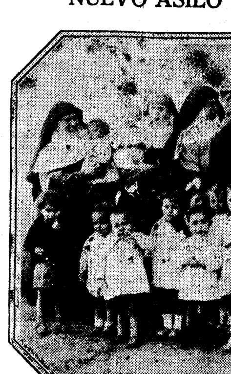
Las hermanas de Jesús Nazareno con los primeros niños acogidos en el Asilo de San José