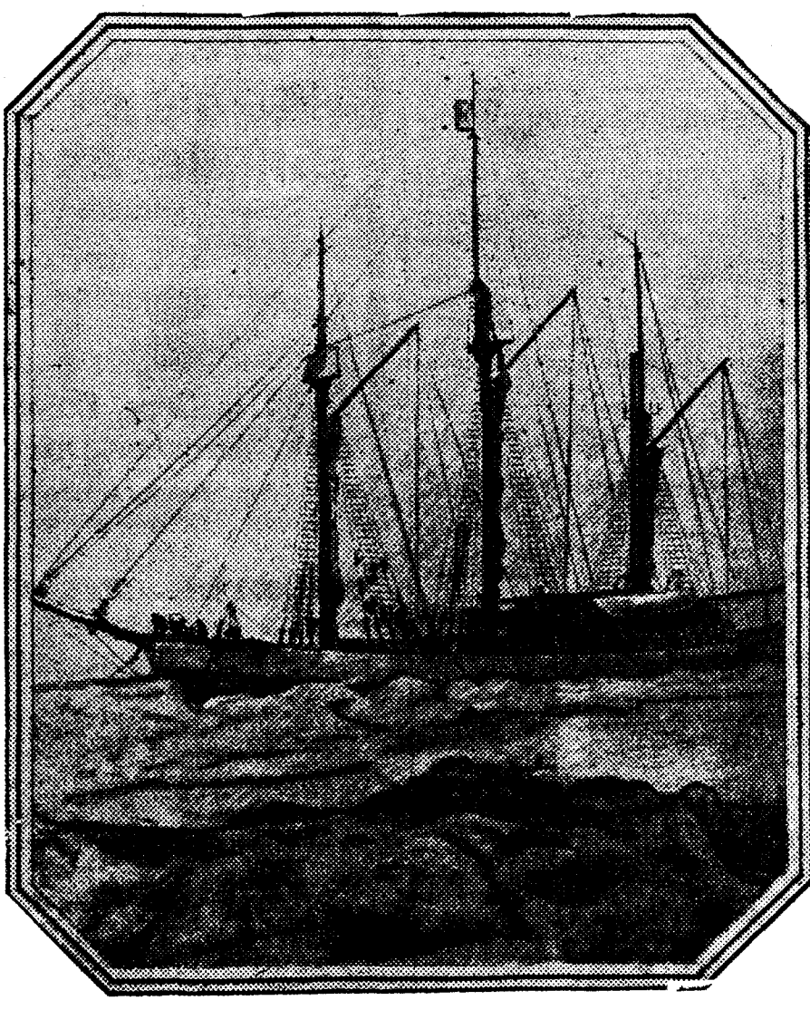
El barco «Maud», que desde 1918 estuvo en los mares árticos y que ha sido vendido en 8.000 libras a un americano. Era propiedad del capitán Roald Amundsen. El barco aparece en la fotografía entre los hielos del Océano Ártico.