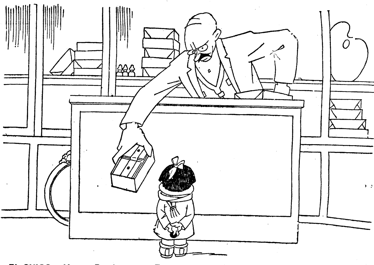
EL CHICO.—No, no. Papel continuo. Es para escribir a los Reyes.