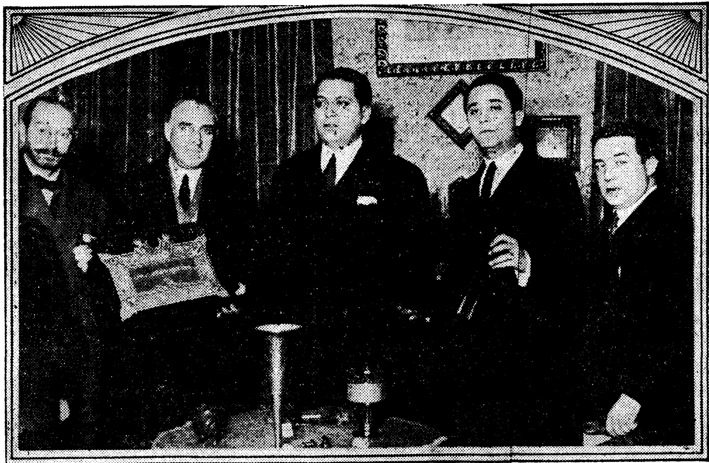
Entrega al señor Calvo Sotelo de una cartera de despacho por una Comisión del Cuerpo de Secretarios Municipales de Valencia