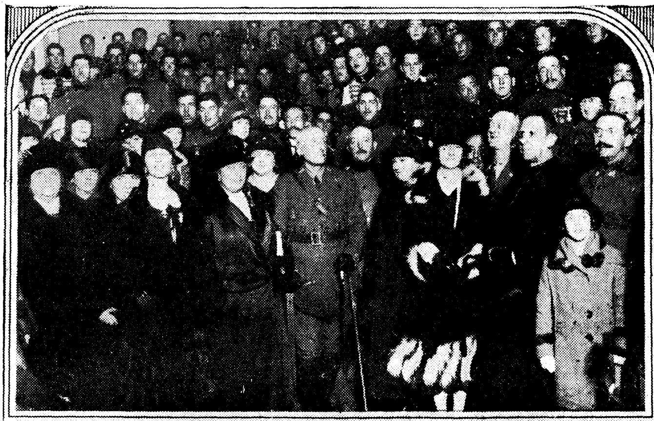
Grupo de concurrentes al reparto de cartillas de la Caja Postal entre los soldados que más se distinguieron por su aplicación en las clases de los regimientos