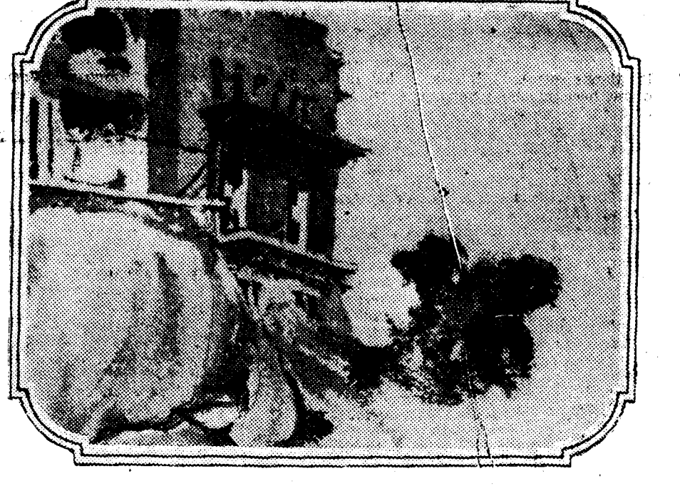
Cuadro que pintó Maura el domingo por la mañana, poco antes de que le sorprendiera la muerte