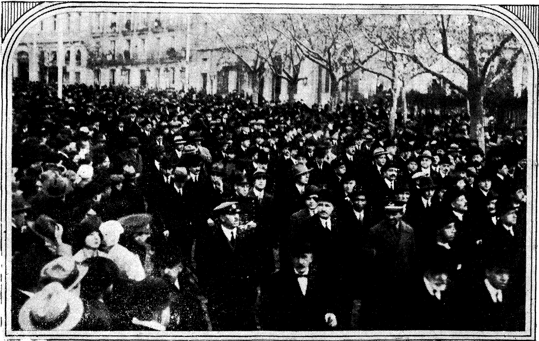
La comitiva al entrar en el Paseo del Prado