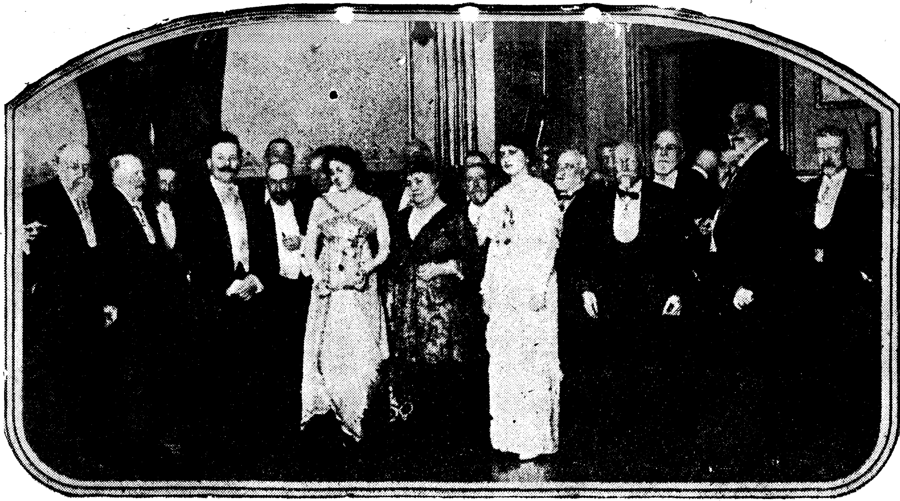
El señor Maura con su esposa e hijos y las personalidades que acudieron a la fiesta con que celebró en su domicilio el nombramiento para presidente de la Real Academia Española

El primer acto del nuevo diputado fué presentar, en la sesión de 22 de diciembre de 1881, una exposición del Ayuntamiento de Manacor (Mallorca) adhiriéndose a la reforma de las leyes Municipal y Provincial. Hasta 1885 la figura de Maura no se destaca en el Parlamento; pero, en cambio, adquiere relieve extraordinario en el Foro.