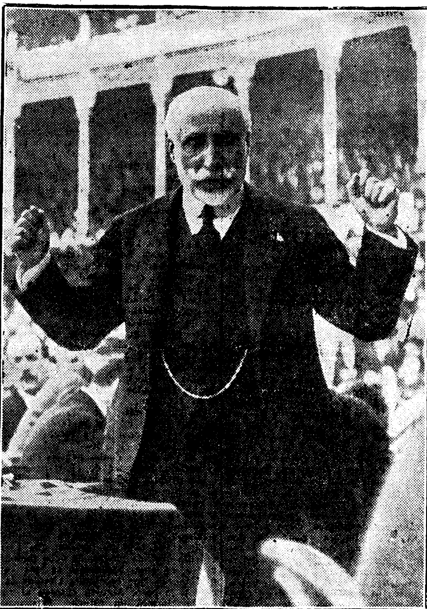
El señor Maura, en uno de los momentos más brillantes del discurso pronunciado en la Plaza de Toros de Madrid, sobre la política internacional de España

—ontrando Maura ambiente para mantener sus compromisos, abandonó la cartera. Con él salió también del Gobierno Gamazo. Poco después estallaba la insurrección separatista, fomentada por el aplazamiento de las reformas y la desorganización militar.