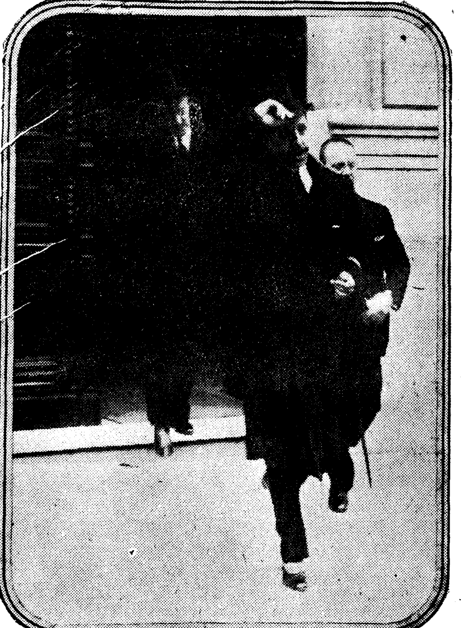
Su majestad al salir de la casa de don Antonio Maura después de oír una misa en la capilla ardiente