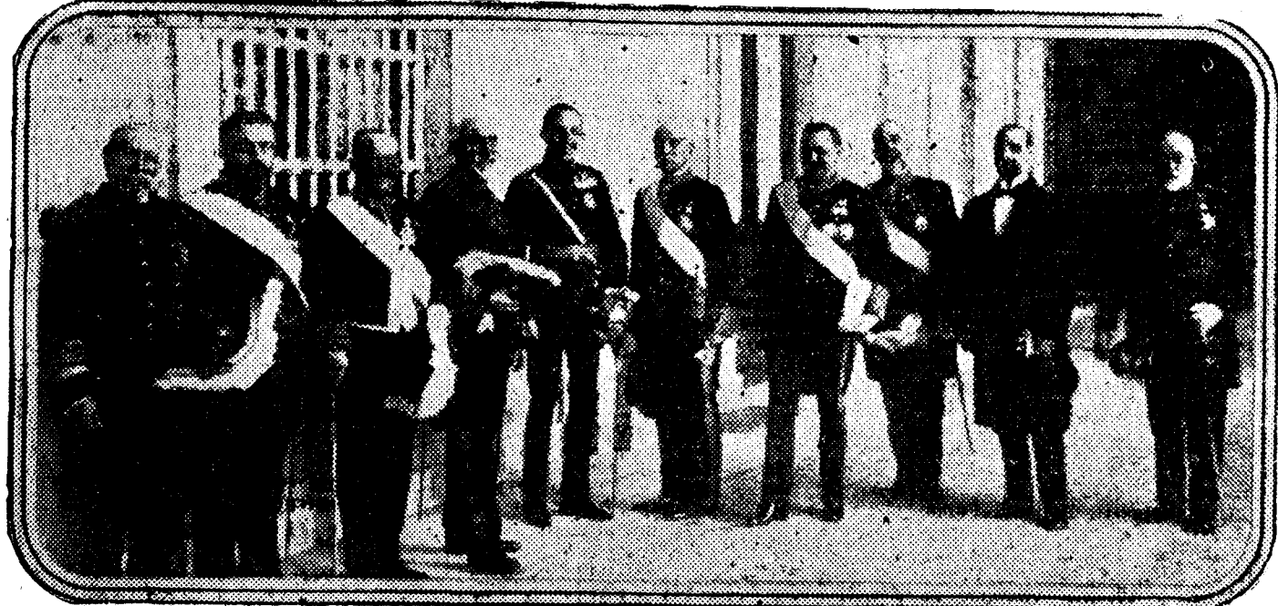
Don Antonio Maura, después de jurar el cargo de presidente del Gobierno nacional, el 22 de marzo de 1918