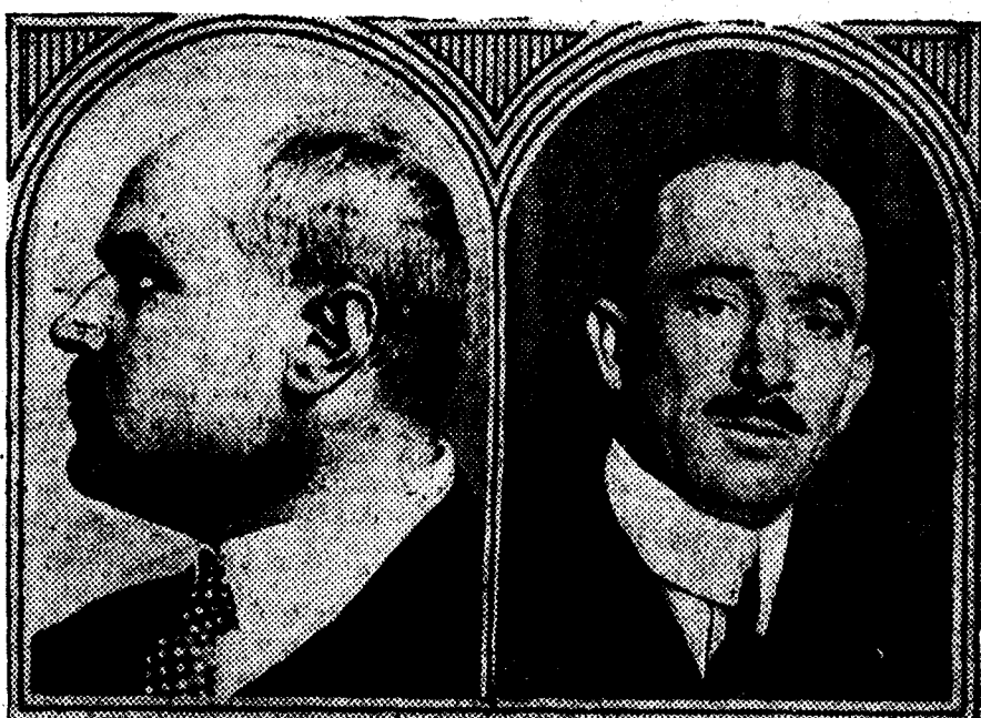
Svehla, jefe de los agrarios, que continúa desempeñando la jefatura del Gobierno, y Benes, que sigue al frente del ministerio de Negocios Extranjeros