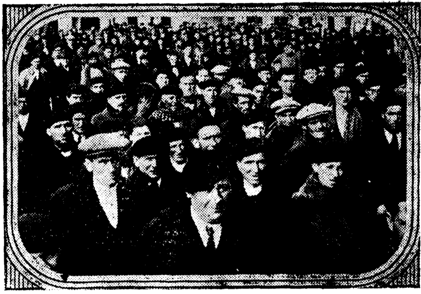
Grupo de asambleístas esperando ante el Gobierno civil de Zaragoza la salida de la Comisión que fue a entregar las conclusiones al gobernador.