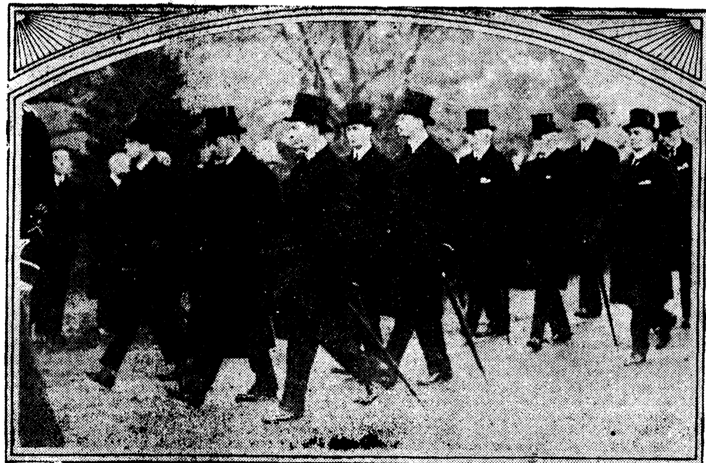
El rey Jorge, el Príncipe de Gales y el duque de York siguen al arnés que conducía los restos de la reina Alejandra, al trasladarlos de Sandringham a Londres