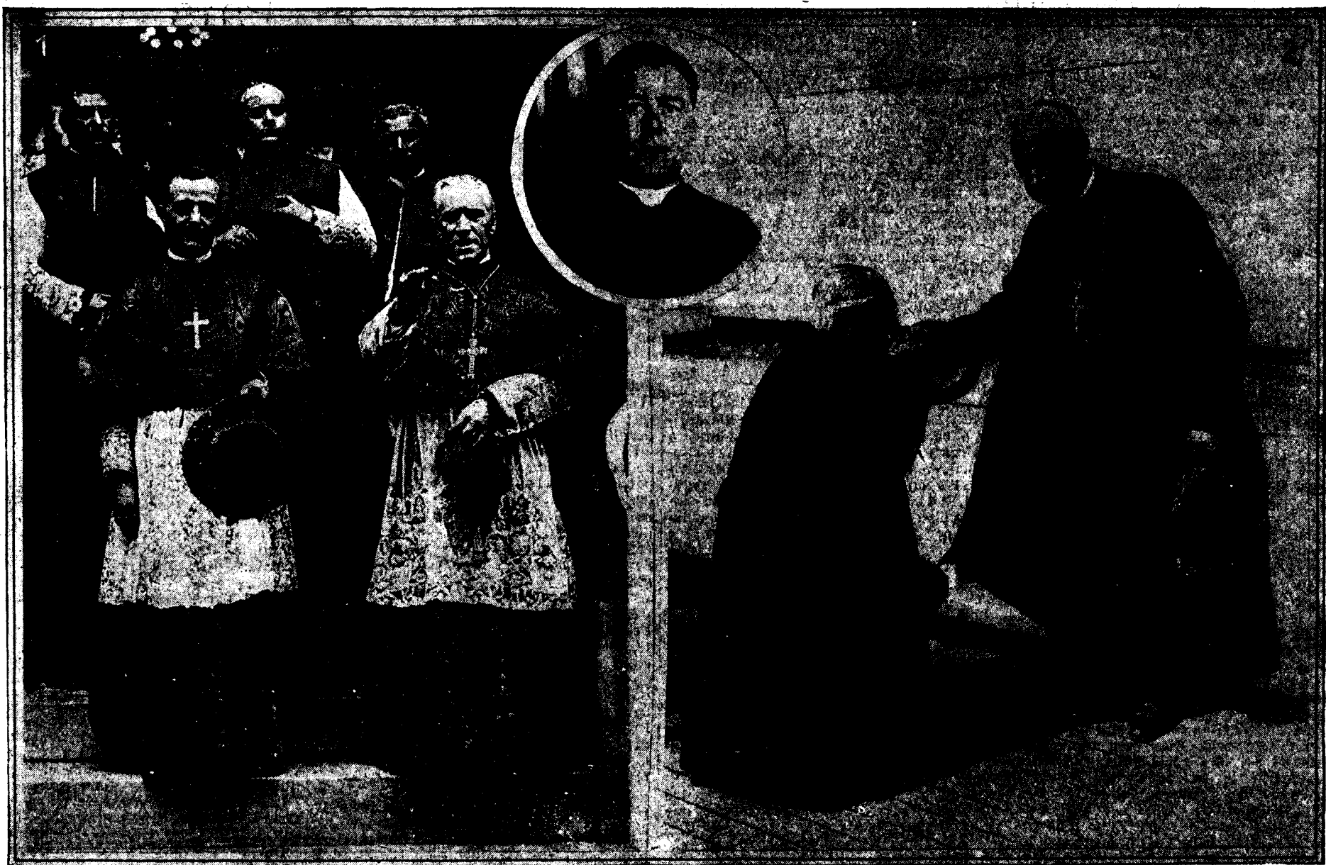
1. El Legado pontificio, Cardenal Bonzano (a la izquierda), y el Cardenal Hayes, de Nueva York (a la derecha), presenciando en la escalinata de la Catedral de San Patricio el desfile de la magna procesión por la Quinta Avenida. 2. El embajador de España en los Estados Unidos, señor Riaño, besando el anillo pastoral al Cardenal Primado a la llegada de este a Nueva York para asistir al Congreso Eucarístico. En el círculo el Prelado presidente del Congreso Eucarístico, monseñor Hoban