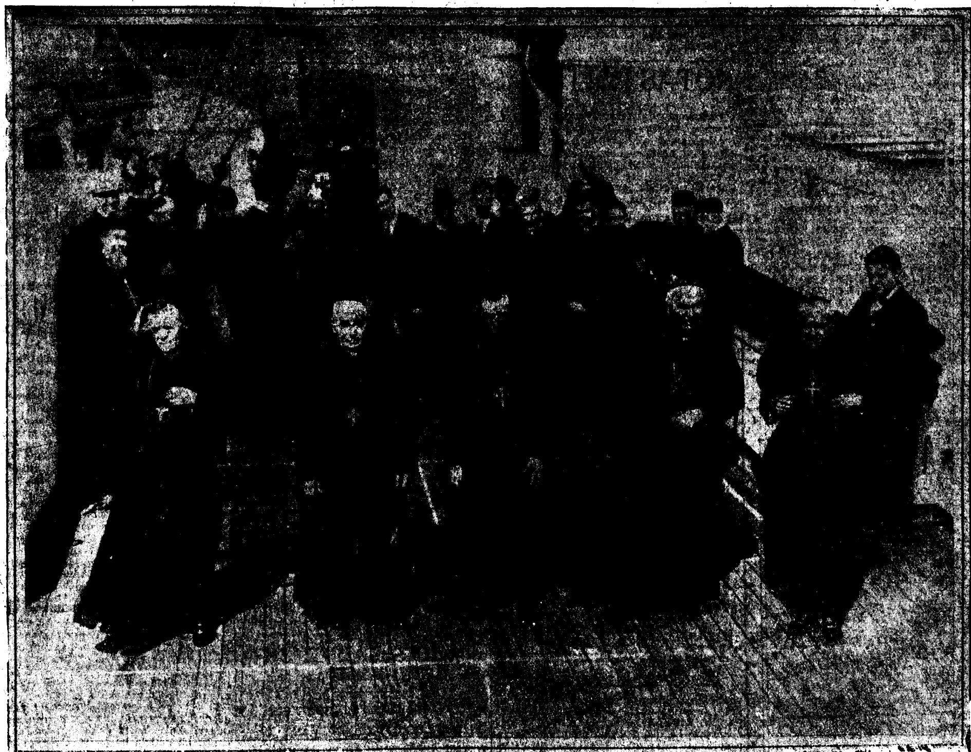
Los Cardenales a bordo del «Aquitania», que les condujo a Nueva York para asistir al Congreso Eucarístico de Chicago. De izquierda a derecha: Cardenal Dubois, de París; Cardenal Czernick, de Budapest; Cardenal Bonzano, Legado pontificio; Cardenal Piffi, de Viena; y Cardenal Reig y Casanova, Primado de España