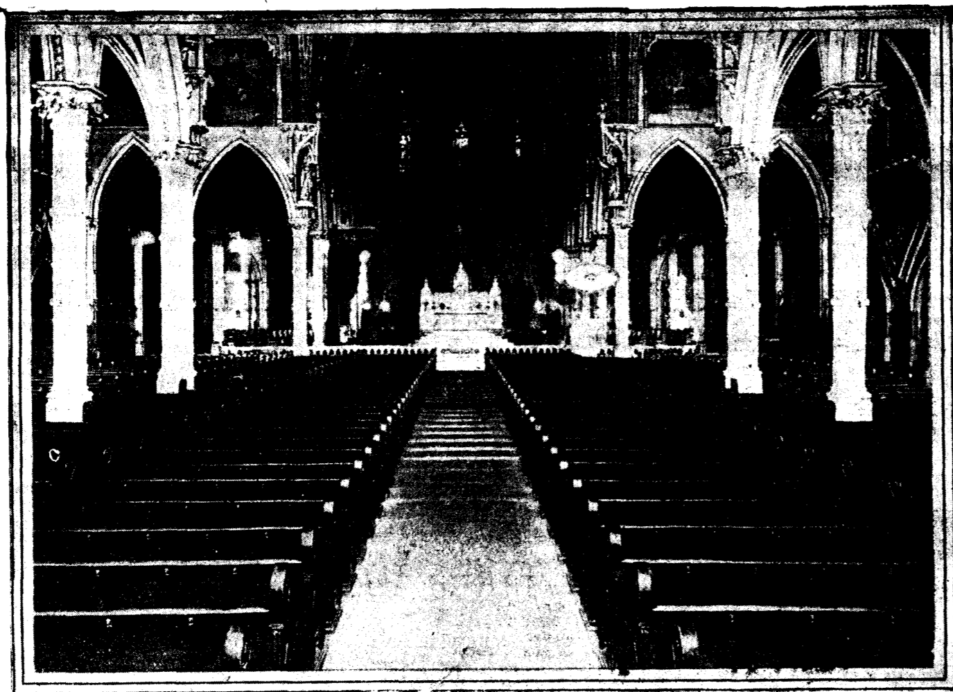
Interior de la Catedral de Chicago, donde hoy se celebrará la sesión de apertura del C. Eucarístico Internacional