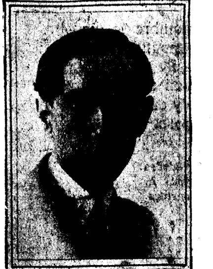
Bilbao, 3 de junio.

Para informes verbales dirigirse a la Secretaría de la A. C. N. de P., de seis a ocho de la tarde.