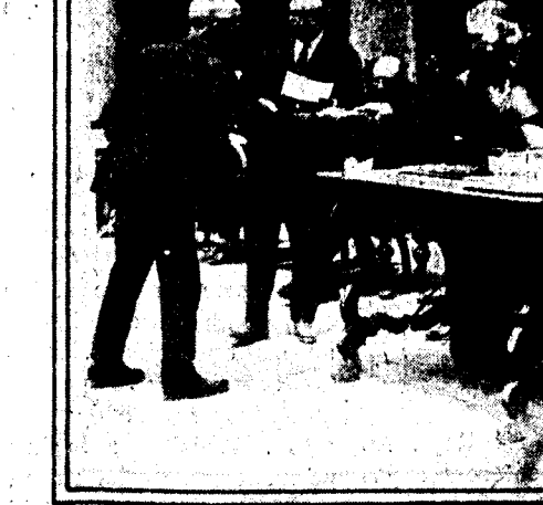
El eminentísimo Cardenal doctor Casanova, repartiendo premios a los ancianos en el homenaje que se les tributó en la A-hambra