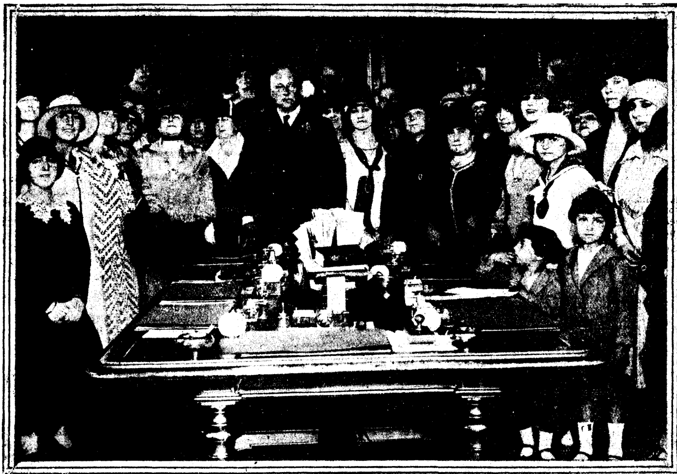
El marqués de Estella en el palacio de la Presidencia, rodeado de un grupo de la manifestación de señoras que el domingo le tributó sentido homenaje