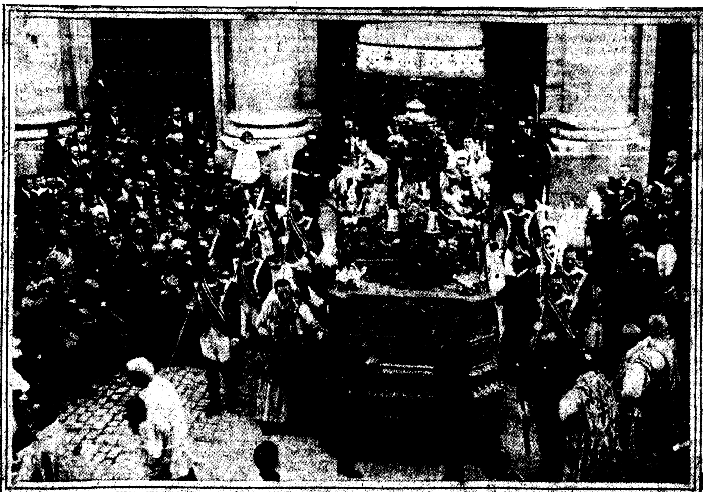
Salida de la Catedral del Santísimo Sacramento en su carroza procesional.