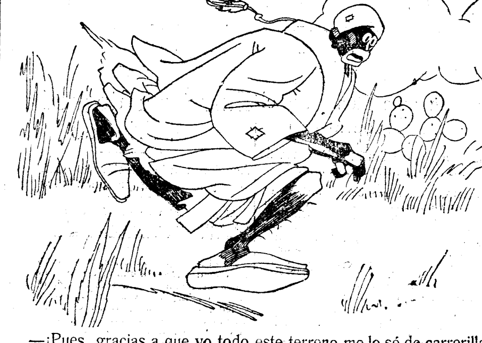
—¡Pues, gracias a que yo todo este terreno me lo sé de carrerilla!