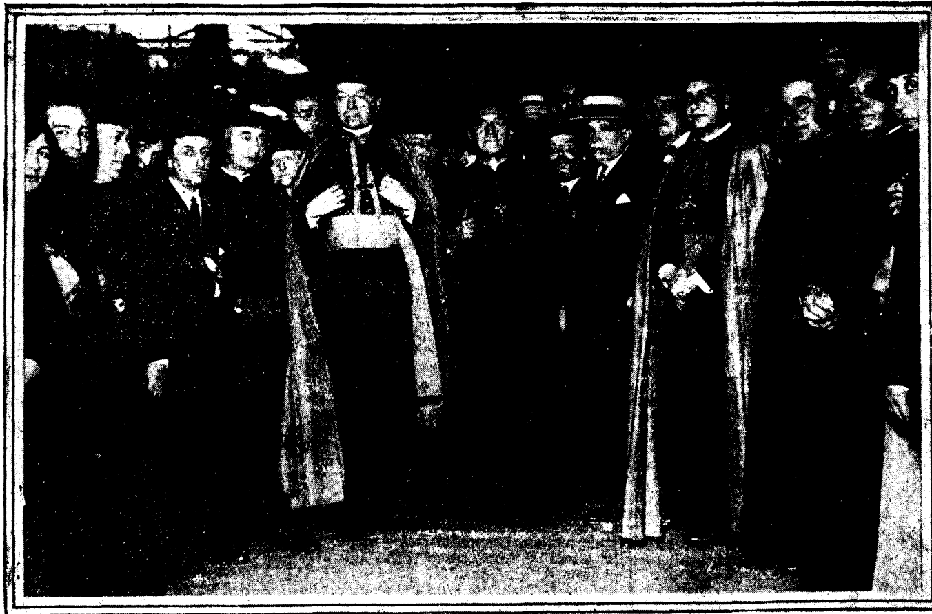
El Nuncio Apostólico, monseñor Tedeschini; el Obispo de Madrid Al alá, doctor Eijo, y otras personalidades despidiendo en la estación del Norte al eminente Cardenal Primado, doctor Reig, que anoche marchó con dirección a Chicago.