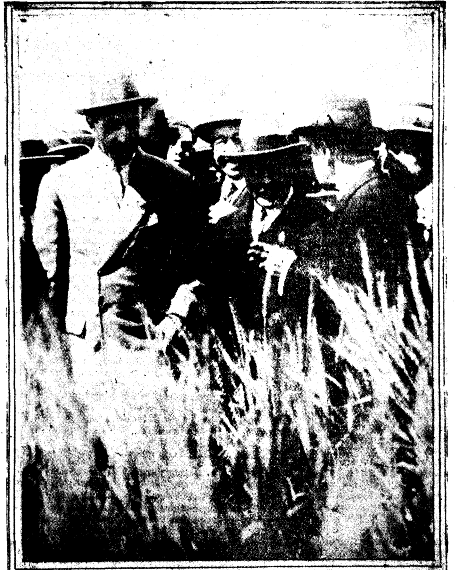
Su majestad el Rey con algunos de los asistentes a la conferencia que ayer mañana dió en la Casa de Campo el señor Arana.