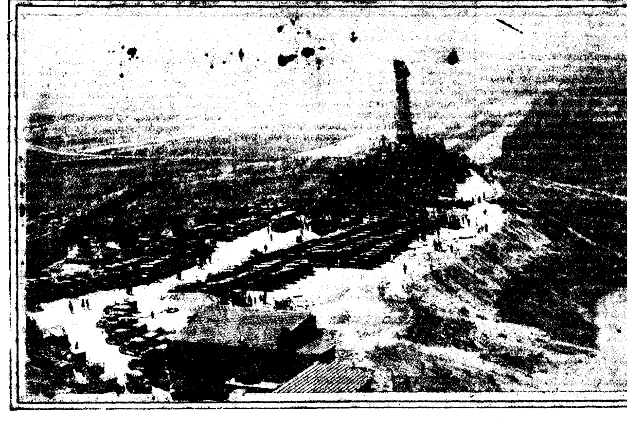
El Cerro de los Angeles durante la fiesta con que se celebró el VII aniversario de su inauguración. Vista tomada desde un aeroplano construido en la fábrica de don Jorge Loring, de Carabanchel Alto. Obsérvase que la concurrencia de peregrinos está reducida por la distancia a una mancha enorme.