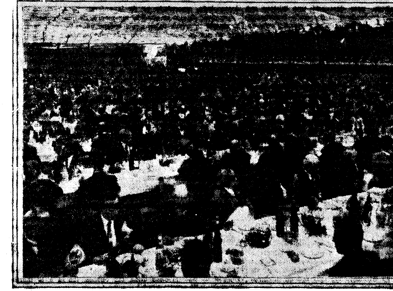
Vista de conjunto del banquete-homenaje al señor Milá y Camps, celebrado en Arenys de Mar, en el que pronunció un discurso el general Primo de Rivera