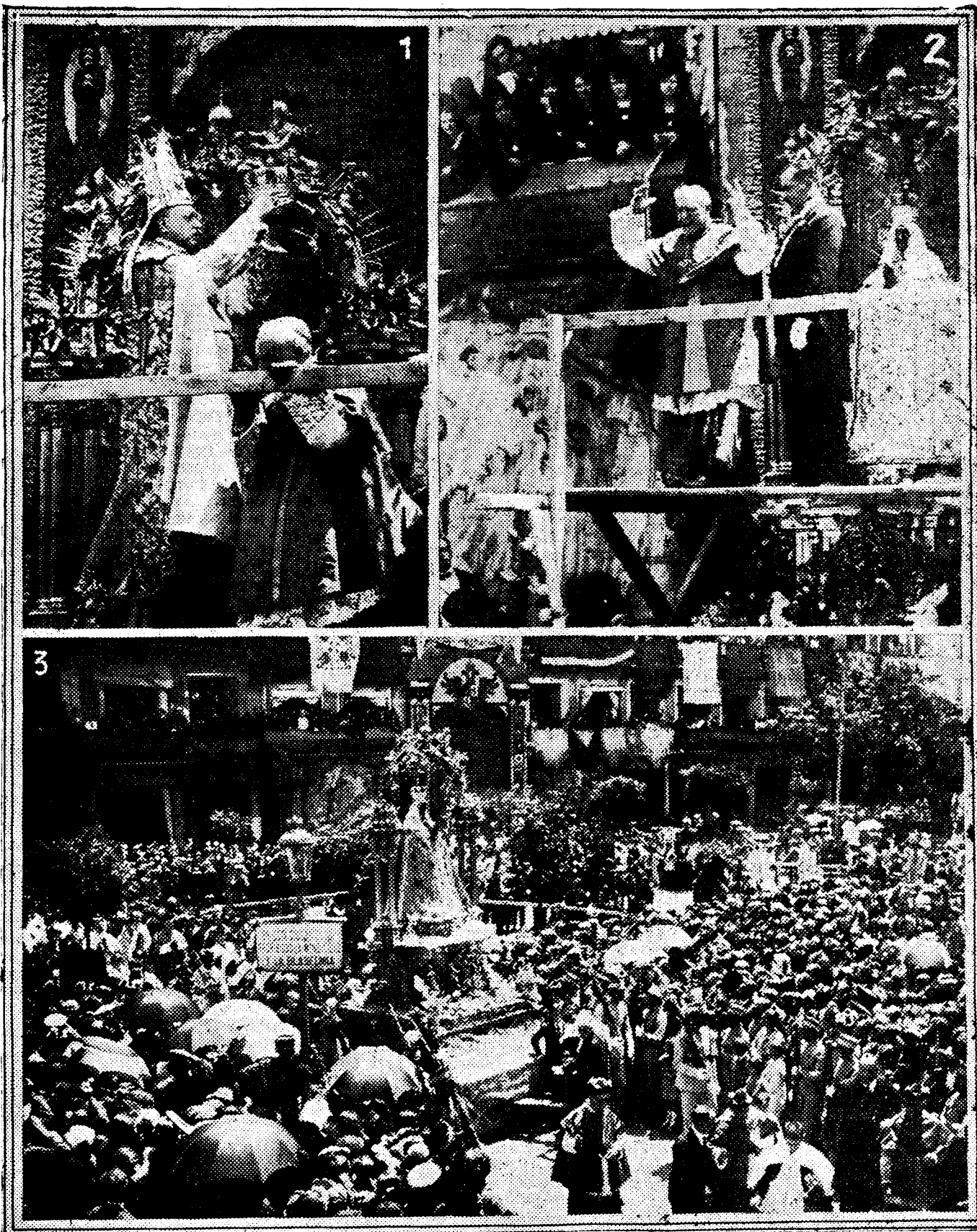
1. El Nuncio de Su Santidad, monseñor Tedeschini, bendiciendo al pueblo con la corona de la Virgen. 2. El Cardenal Primado, doctor Reig, pronunciando un discurso después de la coronación. 3. Aspecto que ofrecía el Zocodover al regresar la procesión a la Catedral después de la solemne ceremonia