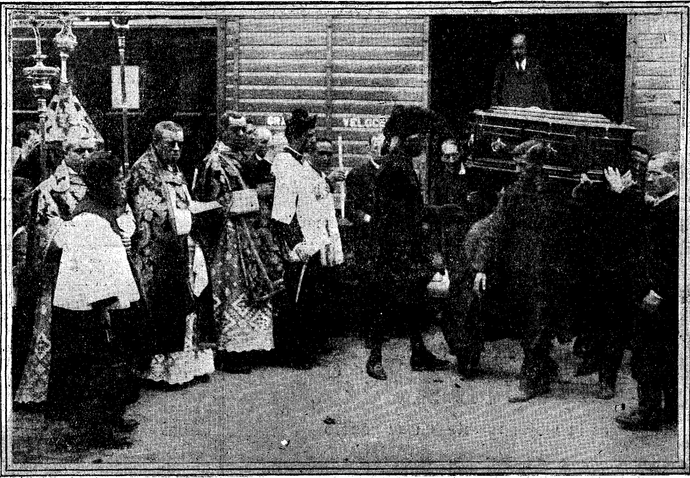
Momento de sacar el féretro del vagón que trajo desde Bruselas los restos del embajador español en Bélgica