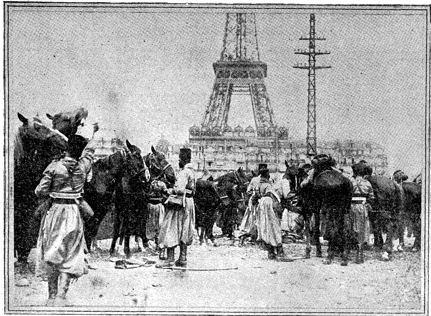
Llegada de soldados de la Guardia Negra del Sultán a la estación del campo, cerca de la Torre Eiffel, para asistir a las fiestas del 14 de julio