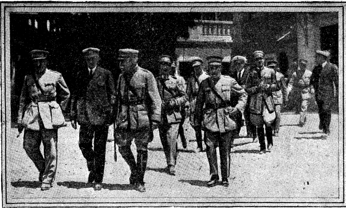
Grupo de los oficiales que se personaron en el palacio de Belem para pedir la dimisión de Gomes da Costa