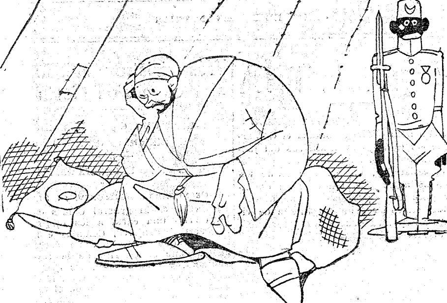
—Me illa, Madagascar, ¡cuán atormentáis mi mente!