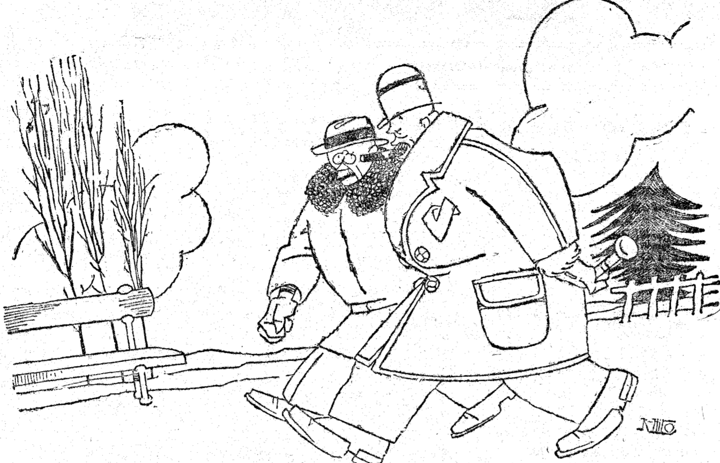
—¿Eh? ¿Qué tal? Ex ministro, presidente de la Asociación de la Prensa, presidente de la Sociedad de Autores, médico, gastrónomo... Seamos sinceros. —No, hombre. Seamos Francos.