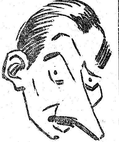
Don Pedro Parajés

Por su cargo de presidente del Real Madrid F. C., era una de las personalidades más salientes de la región Centro. Nombrado tesorero de la Federación Española de Fútbol, su prestigio se ha extendido en el país, máxime en los actuales momentos en que a cada paso se celebran partidos de «preselección», de «anteselección», de «antepreparación», de «preparación» y de «selección» del equipo nacional español. Decimos esto, puesto que está reconocido por todos que del triunvirato federativo es el que más bien lleva la cuestión técnica. Es el que ha dirigido el equipo español que marchó a Italia, por lo que es una de las figuras que más se destacan en la actualidad.