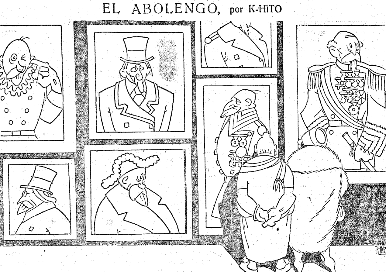
LA SEÑORA DE LA CASA.—Todos, absolutamente todos, son de mi familia. LA VISITA.—¡Caramba, caramba! Pues pida usted el auxilio a las familias numerosas.

Sabido es, y nadie osará ponerlo en tela de juicio, que el hábito no hace al monje, pero es en igual grado innegable que un buen hábito y por añadidura bien llevado, puede hacer pasar por reverendísimo padre prior a quien de tal no tenga más que las apariencias.