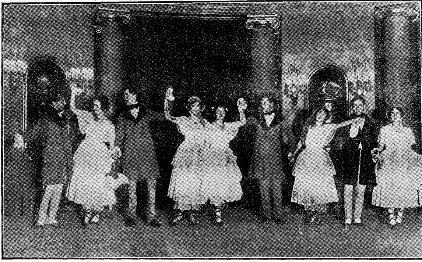
Uno de los cuadros que representarán hoy señoritas de la aristocracia en la fiesta organizada por la Cruz Roja, para recaudar fondos destinados al «Aguinaldo del soldado»