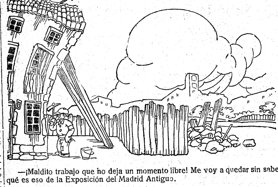
—¡Maldito trabajo que no deja un momento libre! Me voy a quedar sin saber qué es eso de la Exposición del Madrid Antiguo.