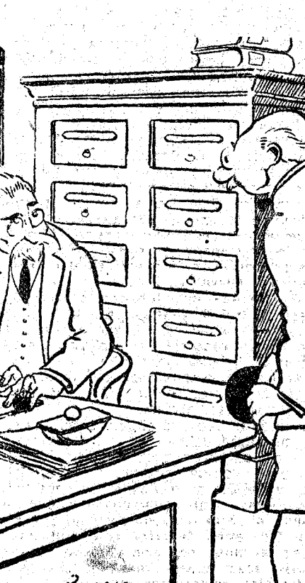
—¿Trabajo? El caso es que, por el momento, no hay gran cosa que hacer. —¡Maravilloso! Yo tampoco trabajo mucho que digamos. (Le Rire, París.)