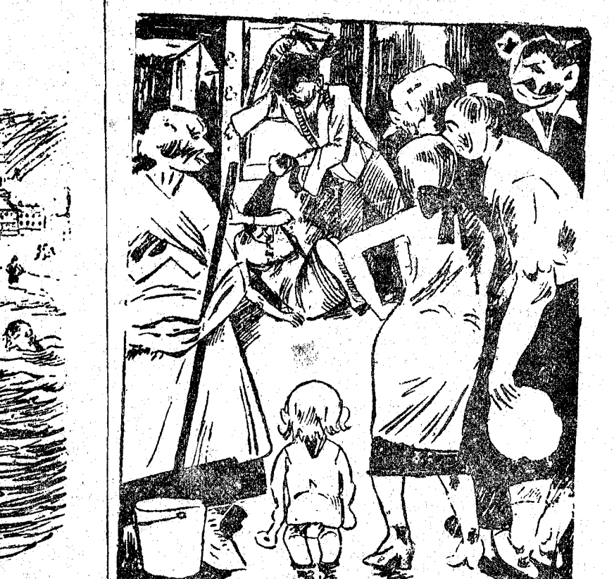
EL MARIDO A SU MUJER.—Comprende, imbécil; es preciso vivir una vida nueva. ¡Desgraciada esclava! Yo haré de ti una mujer libre... ¡A puñetazos te he de meter esto en la cabeza!