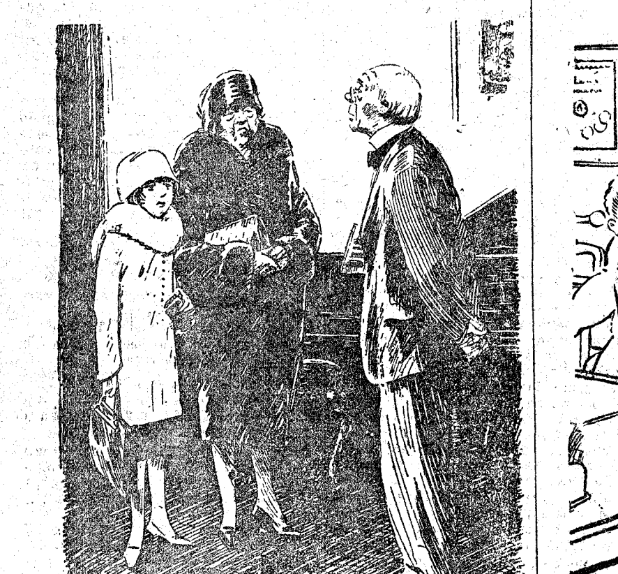
LA MADRE.—Y, según usted, ¿qué trozos serán los mejores para la voz de mi hija? EL PROFESOR DE CANTO.—Yo le recomiendo los coros. (The Humorist, Londres.)