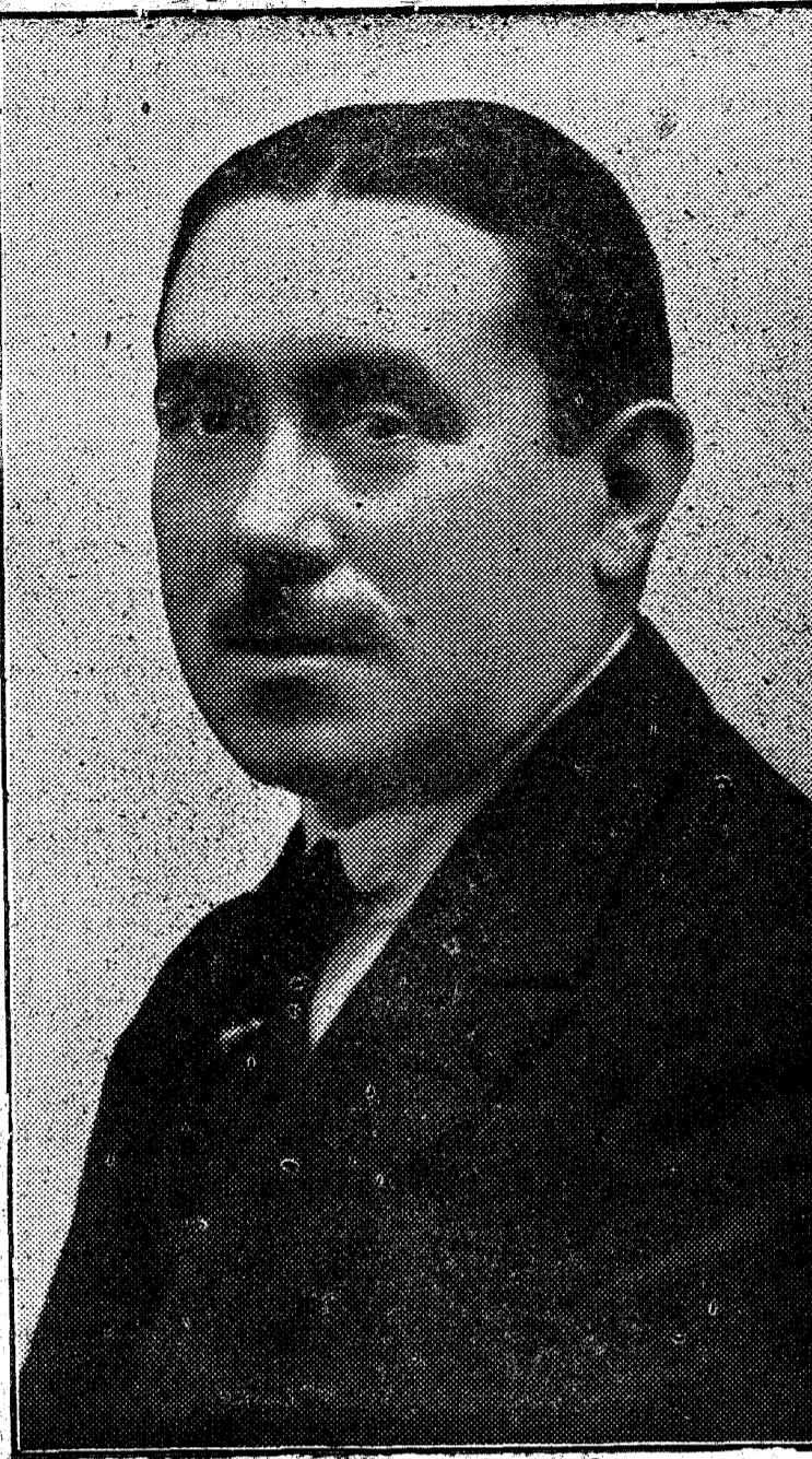
El insigne compositor Joaquín Turina

En estos momentos, en que se reconoce por todos la necesidad de trabajar por el resurgimiento de la música española, son pocos los que tienen la abnegación y el desinterés de luchar por él en la forma más pura y elevada, más difícil y más gloriosa, pero menos remuneradora: la sinfonía. Joaquín Turina, madrista, técnico, artista de impecable forma y de profunda inspiración, figura en el número de estos gloriosos adalides de la música española. Su talento, que desdén los triunfos fáciles, se ha demostrado en sinfonías tan apañadas como «La Virgen del Rocío», y culmina en su «Canto a Sevilla», recibido triunfalmente en el último concierto de la Sinfónica.