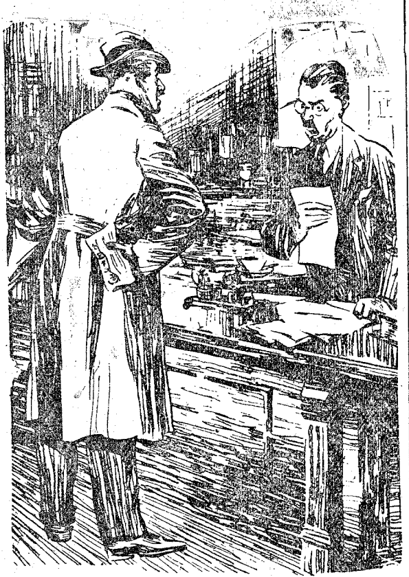
EL CONTRIBUYENTE.—Quería ver al recaudador de contribuciones. EL EMPLEADO.—Lo siento; está fuera. EL CONTRIBUYENTE.—Muy bien. ¿Y cuándo crees que volverá a estar fuera? (Passing Show, Londres.)