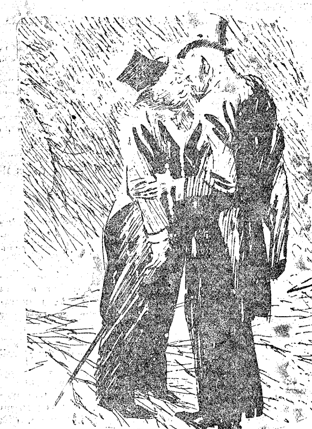
—Oye, ¿sabes dónde vive Tom Maloney? —Pero si Tom eres tú! —Ya lo sé; pero ¿dónde vive? (Passing Show, Londres.)

PRAGA, 28.—Se anuncia que Massaryk, presidente de la república checoslovaca, saldrá la semana próxima para un viaje de descanso en el Mediodía. Después se dirigirá a Ginebra, donde se encontrará con Benes, que estará en Ginebra a causa de la reunión del Consejo de la Sociedad de Naciones. Es la primera vez que un jefe de Estado visitará la Sociedad de Naciones reunida en sesión. De allí el presidente checo irá a Italia, Egipto y Palestina.