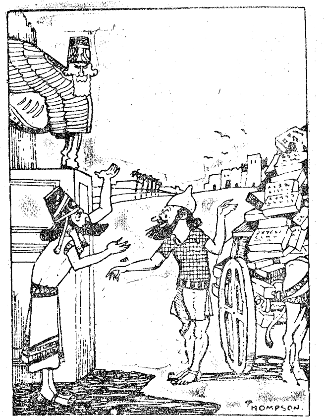
EL DUEÑO DE CASA, ASIRIO.—Yo no he encargado ningún adorno; las obras de esta casa terminarán hace tiempo. —Está bien, señor. Lo que traigo son unas circulares que envía la Compañía de la Enciclopedia asiria. (Passing Show, Londres.)