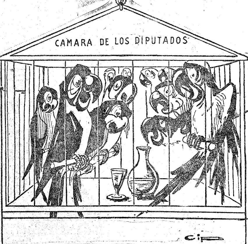
Los diputados se olvidan de que su silencio ha sido de oro!

Alude a que durante la época de restricciones a la verborruidad parlamentaria impuestas por Poincaré, el franco ha subido sin cesar.