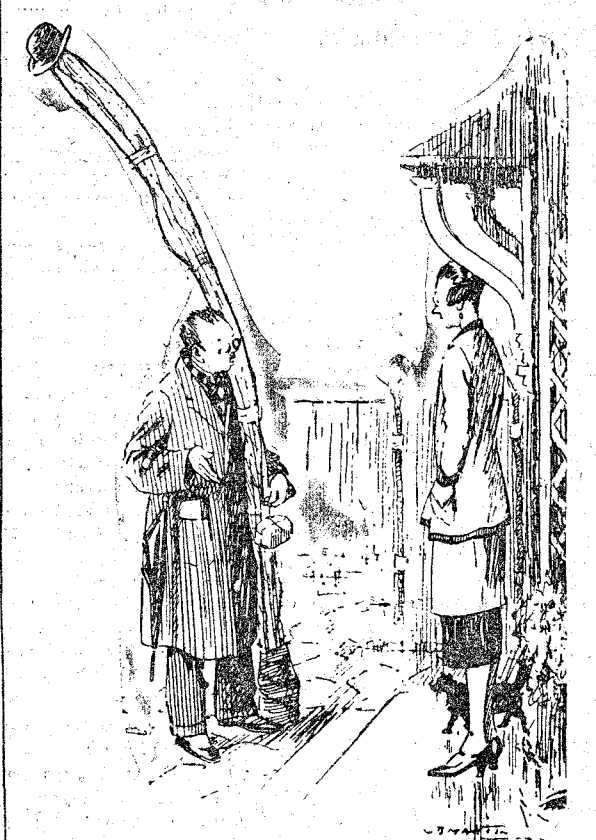
—Son buenas cañas; pero fué bastante difícil coger el cetro en las horas de apreturas, y he perdido mi sombrero (London Opinton, Londres.)