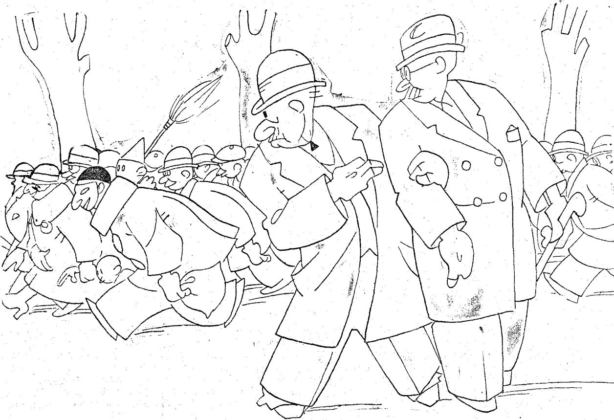
—¿Qué pasa? —Nada. Un bromista que ha dicho que venía una carroza.