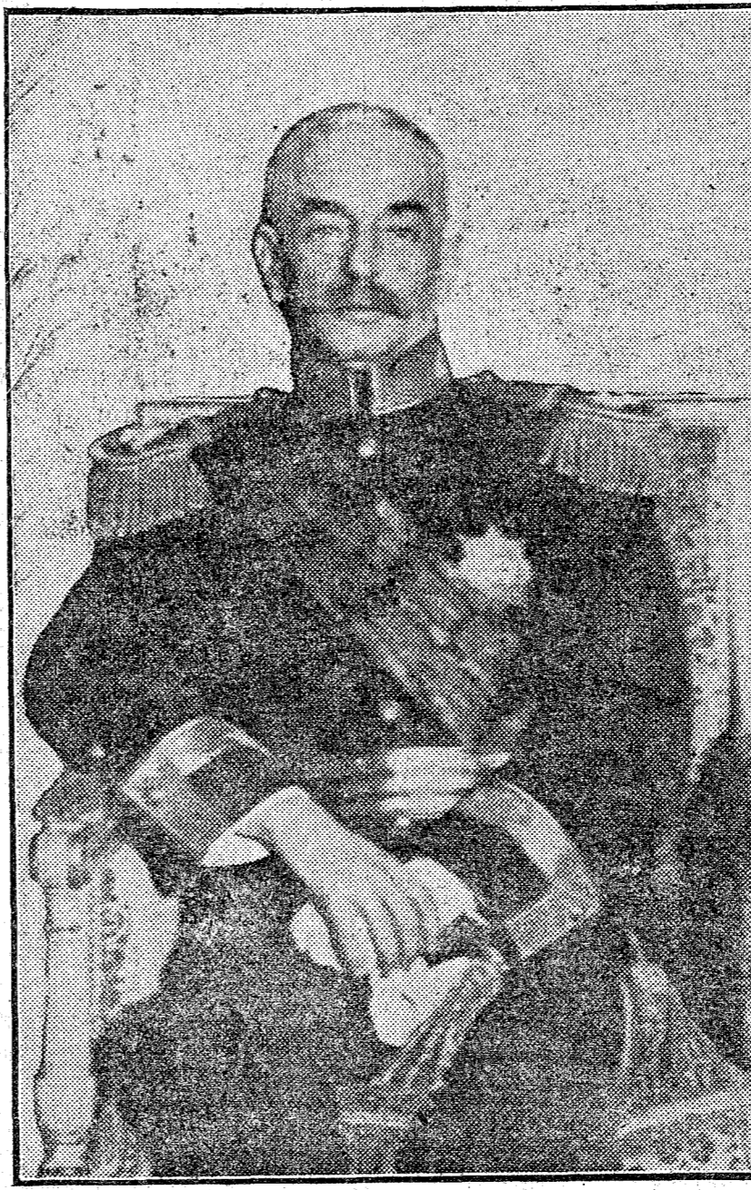
El general Carmona, presidente de Portugal que está procediendo con toda energía contra los complicados en la última intentona revolucionaria