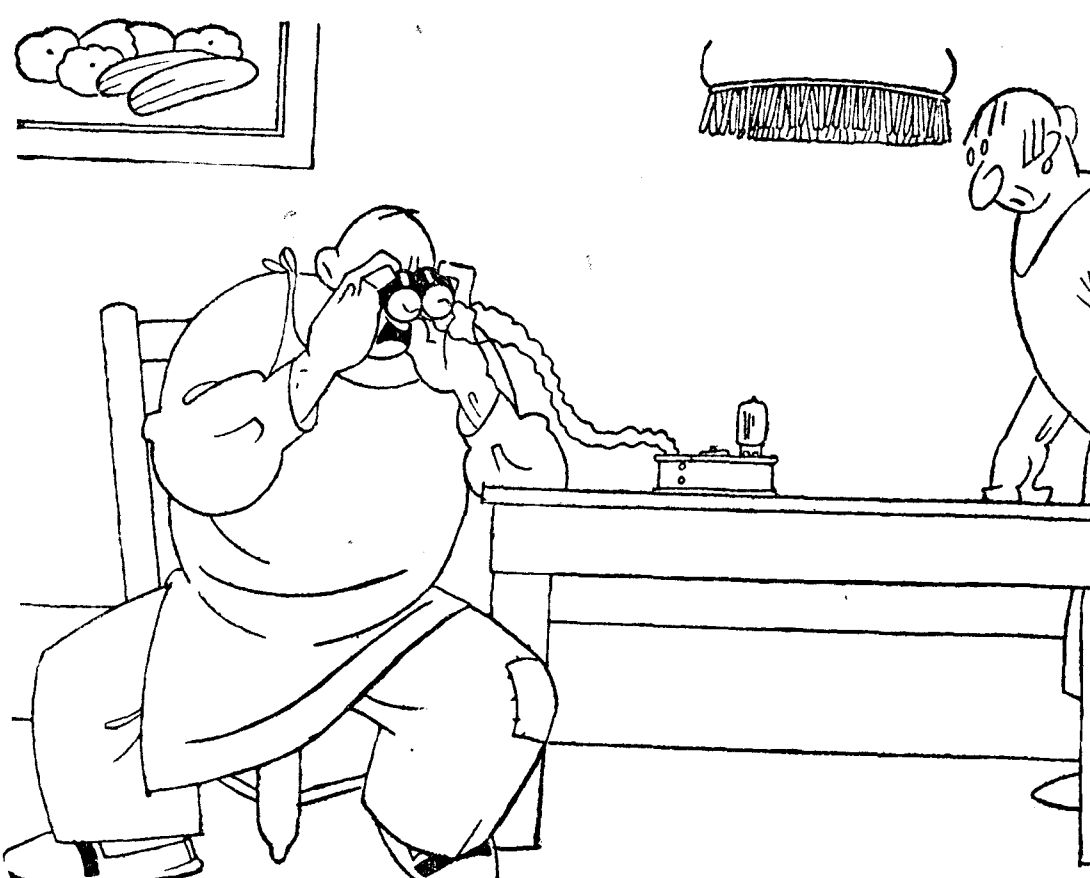
—¡Pronto, Eustaquia, pronto! ¡Tráeme el cocido, que estoy viendo ahora el banquete en la Embajada de Inglaterra!