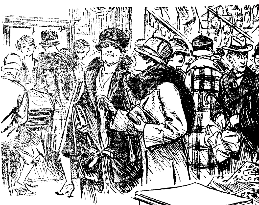
—Me gustan las ocasiones. —Claro, porque se compra barato. —Sí; y hasta se puede una ir sin pagar. (Punch, Londres.)