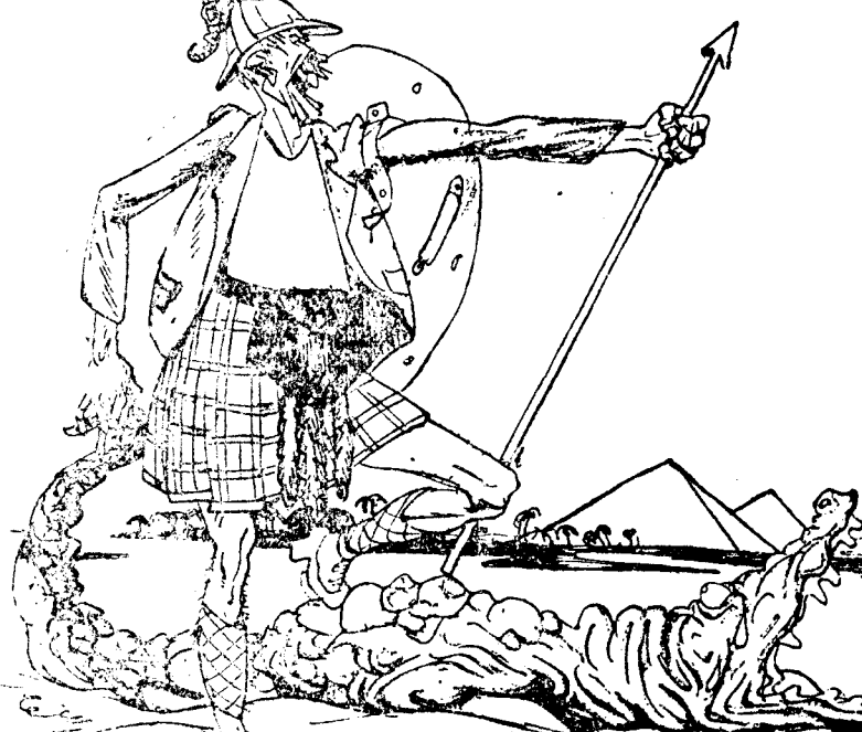
EL LOHENGRIK INGLÉS.—Y ahora gracias, cocodrilo mío; como tú, yo también soy del Nilo. (De Kladderadatsch, Berlín.)

Van a comenzar de nuevo negociaciones entre Inglaterra y Egipto para resolver asuntos pendientes. A un periódico alemán el hecho le inspira una punzante parodia de «Lohengrin».