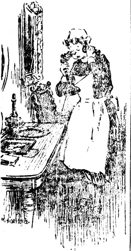
—No, señora, no; la señorita no está en casa. Pero desde luego no puede ir mañana a visitarla, porque me toca salir a mí. (London Opinion, Londres.)

«No he podido resistir—dice Bourget— al placer de transcribir este testimonio, lamentando una vez más vivam me que el error político haya sin cesar extrañado y a veces rebañado, al autor de la «Legenda de los siglos».