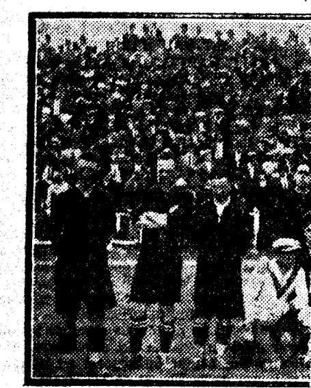
EQUIPO DEL REAL UNION DE IRUN