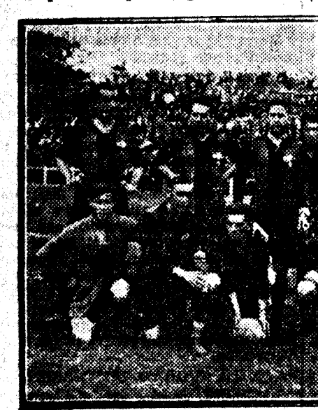
EQUIPO DEL ARENAS CLUB DE GUECHO