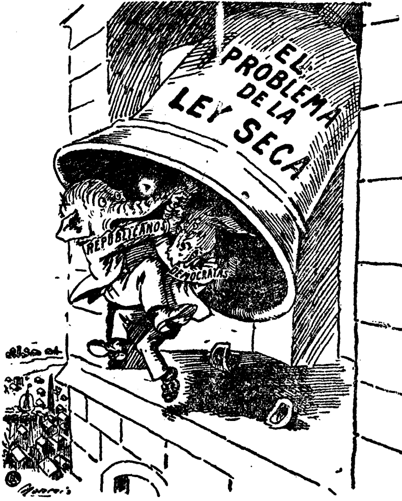
ESTA NOCHE NO SONARÁ EL CUBREFUEGO

Alude a la confusión en los partidos políticos yanquis. Tanto los republicanos como los demócratas están profundamente divididos en la cuestión de la ley seca, y así ninguno puede hacer a los electores un llamamiento claro sobre este particular, aunque bien quisieran hacerlo.