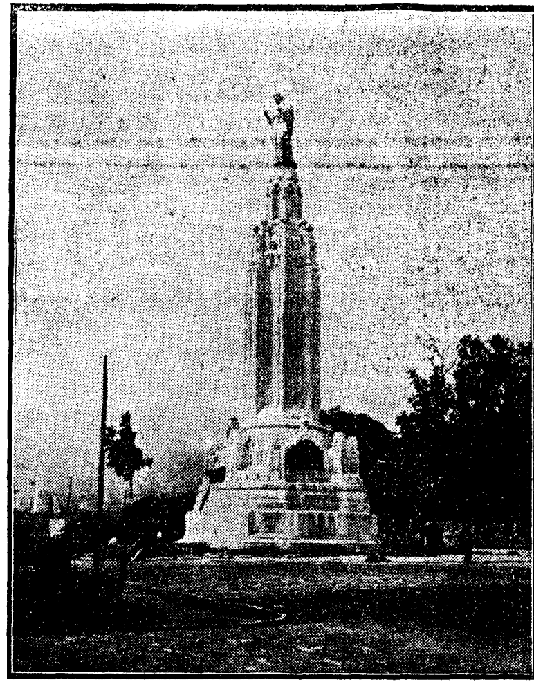
Este grandioso monumento se adjudicó en concurso internacional en 1923, entre cien concursantes de todas las naciones; mide 40 metros de altura en total; el pedestal, 33, y la estatua de Cristo, en bronce sobredorado, siete. Son autores de esta obra el escultor Coullaut Valera y el arquitecto don Pedro Muguruza