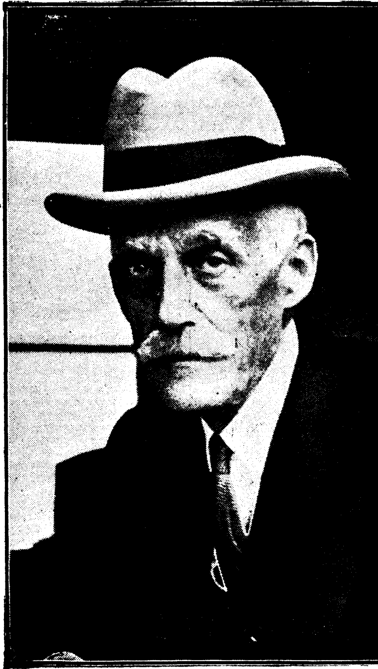
Mister Andrew William Mellon, secretario del Tesoro de los Estados Unidos, que ha recaudado en un sólo día por valor de catorce mil millones de pesetas

Misler Mellon es secretario del Tesoro desde 1921. Le ha tocado la época difícil de la liquidación de la guerra; pero también le toca hoy presidir desde su puesto el momento de mayor prosperidad de la Hacienda norteamericana. Puede representar mister Mellon ante el público el simpático papel del hombre que rebaja cargas e impuestos y ofrece al país balances altamente satisfactorios. El superávit del actual presupuesto yaqui es de 600 millones de dólares, o sea, de unos 3.500 millones de pesetas.