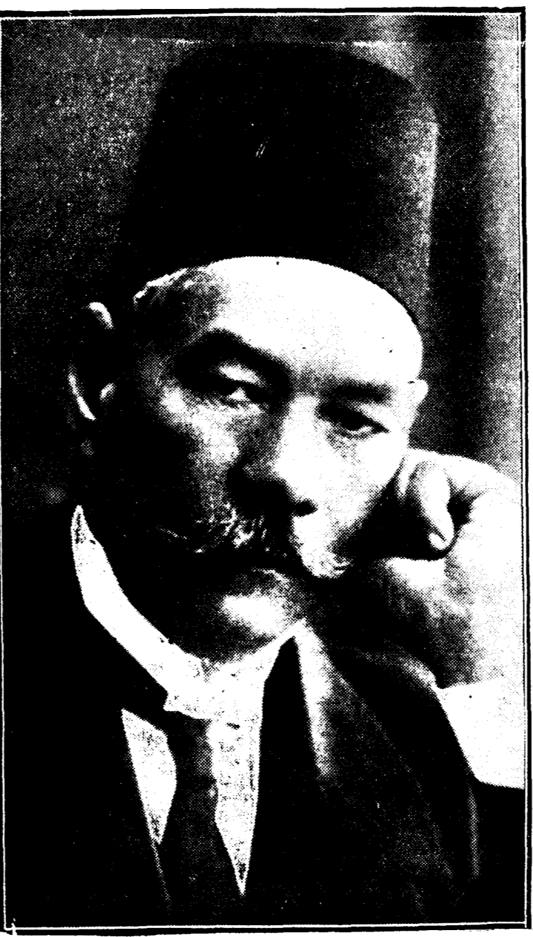
Zaglul Pachá, jefe de los nacionalistas egipcios que han ocasionado el último incidente con Inglaterra