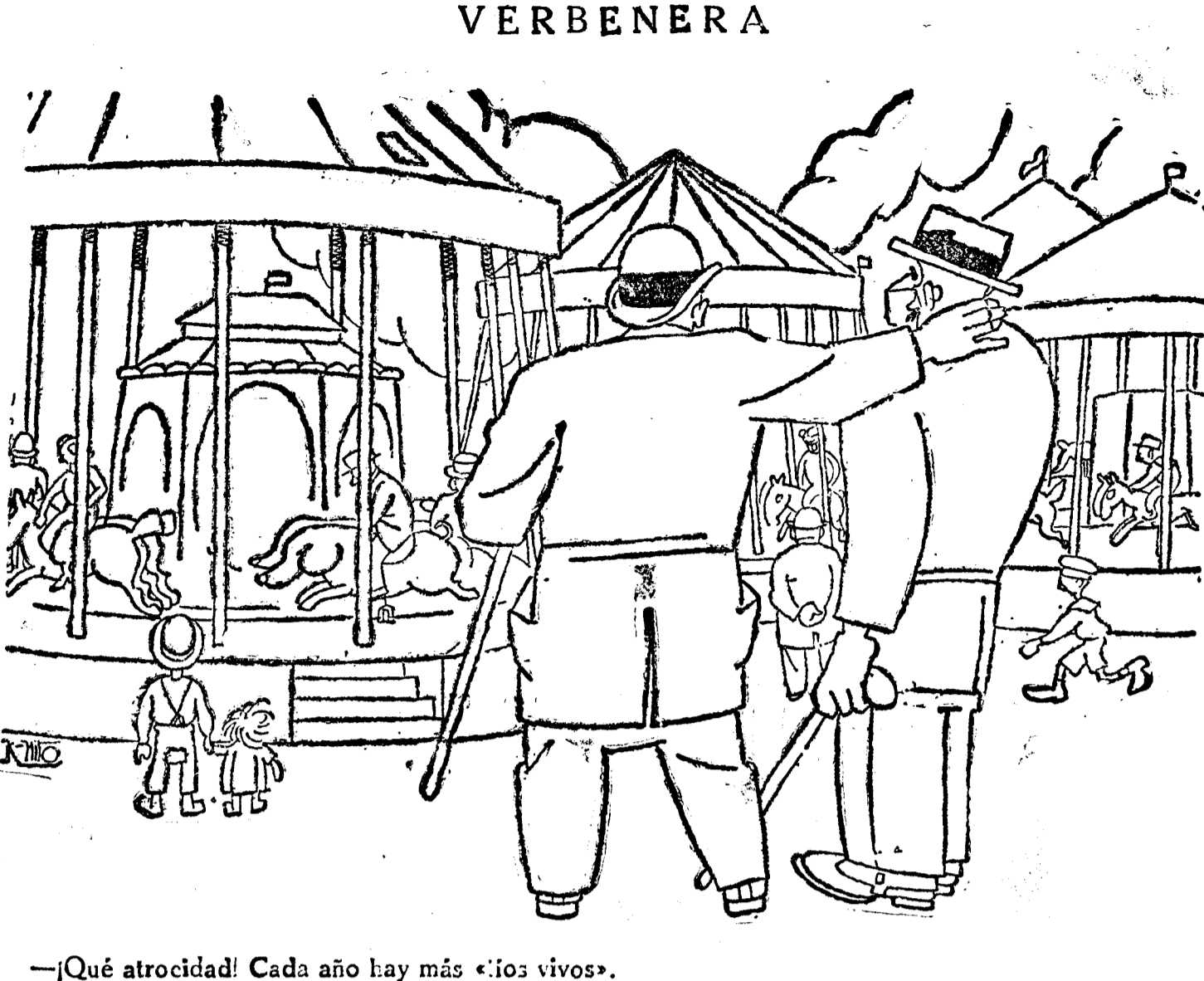
—¡Qué atrocidad! Cada año hay más «fijos vivos».