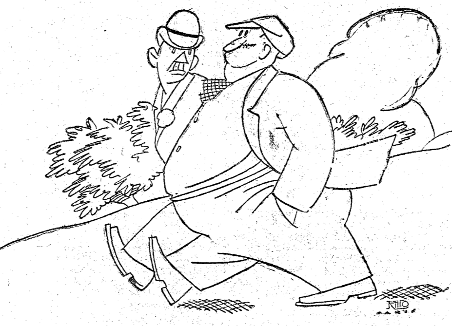
—Para ir a un país extranjero hay que conocer a fondo el idioma. Yo fui a París sin saber decir más que «un verre d'eau»..., y fijese usted la hidropesía que traje.