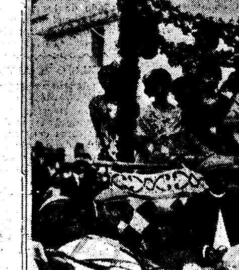
La carroza de la Agricultura, ocupada por distinguidas señoritas, en la cabalgata celebrada con motivo de la fiesta de los agricultores.