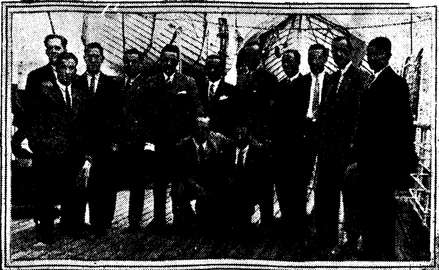
El equipo del Club Deportivo Español, de Barcelona, en la cubierta del «Alfonso XIII», en Santander, a su regreso de la «tournee» deportiva por América.