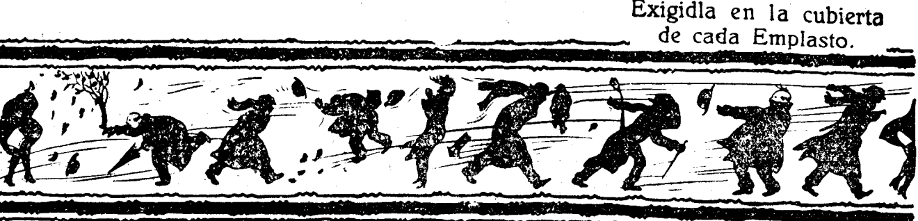
MARCA REGISTRADA Exigida en la cubierta de cada Emplasto.

Desconfíe de las imitaciones. No pida un parche poroso; pida y exija siempre un Emplasto poroso del Dr. WINTER. Es el único medicinal.