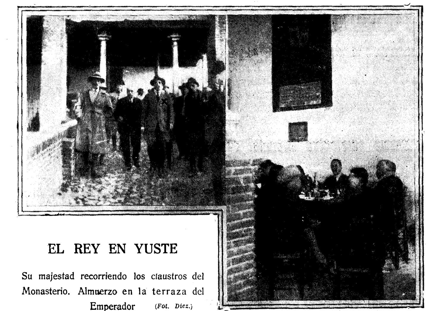
EL REY EN YUSTE

PARIS, 15.—El Petit Journal dice que la ex Emperatriz Zita se halla de paso por París de riguroso incognito con objeto, dice, de arreglar asuntos particulares.