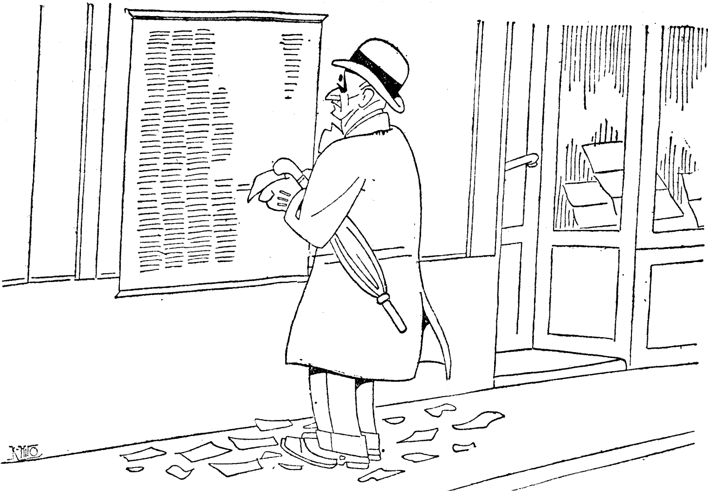
—¿Y qué hago yo con estas pesetejas? Porque... ¡tampoco sé ahora qué partido tomar!

liano y en latín, la Bula con la cual se concedía indulgencia plenaria a todos los presentes. Después el Papa se puso en pie sobre el estrado que ocupaba y trazó en el aire las tres cruces, pronunciando clara y afectuosamente las palabras de la bendición. El silencio sepulcral de tantos miles de personas era más imponente todavía que sus estronadoras ovaciones. Terminada la bendición, estalló, irrefrenable y fragorosa, la tempestad de aplausos y vivas. Los músicos insuflaban en vano con todos sus pulmones las trompetas de plata; los ecos argentinos se perdían en aquel inmenso fragor, agrandado por las oquedades del templo. Así despedía el pueblo fiel a su Pastor, que acababa de abrir la puerta santa y las puertas del Cielo. Eran las dos de la tarde. La ceremonia había terminado.