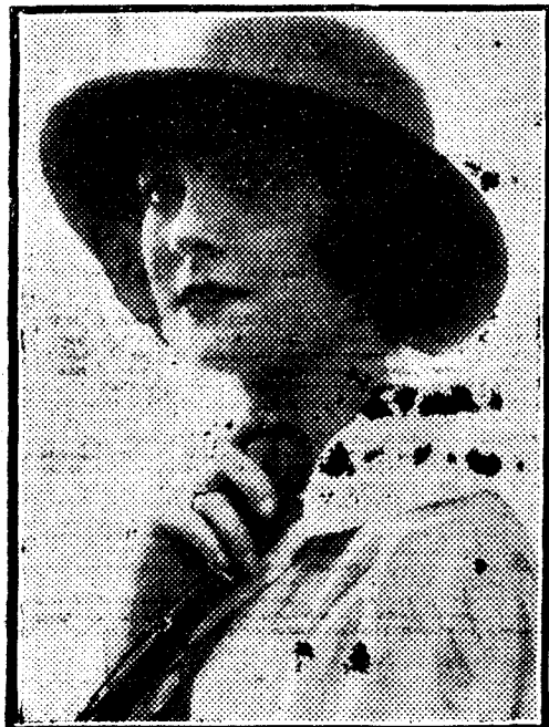
El agente y distinguida, sólo una pasión la elega: la de hacerse los perfumes con las AMPOLLAS OMEGA.

Se remite franco de porte y embalaje a cualquier punto de España, desde seis paquetes en adelante.