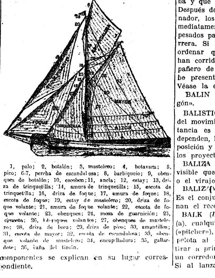
1, palo; 2, botolón; 3, mastelero; 4, botavara; 5, pico; 6, percha de escandalosa; 8, barbiguero; 9, obenques de botolón; 10, escobón; 11, ancla; 12, estay; 13, driza de trinqueta; 14, amura de trinqueta; 15, escota de trinqueta; 16, driza de foque; 17, amura de foque; 18, escota de foque; 19, estay de mastelero; 20, driza de foque volante; 21, amura de foque volante; 22, escota de foque volante; 23, obenques; 24, mesa de guarnición; 25, crineta; 26, lancha volante; 27, obenques de mastelero; 28, driza de boca; 29, driza de pico; 30, amantillado; 31, escota de mayor; 32, escota de escandalosa; 33, obenques de mastelero; 34, encapilladura; 35, gallardete; 36, caña del timón.

21) detalles respecto a estas embarcaciones apropiadas para el admirable deporte de las regatas a la vela. Por otra parte, los distintos