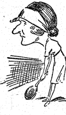
MISS MC KANE Famosa raquetista, que ha obtenido el campeonato mundial en pista cubierta (individual, señoras), que se ha celebrado en Barcelona.