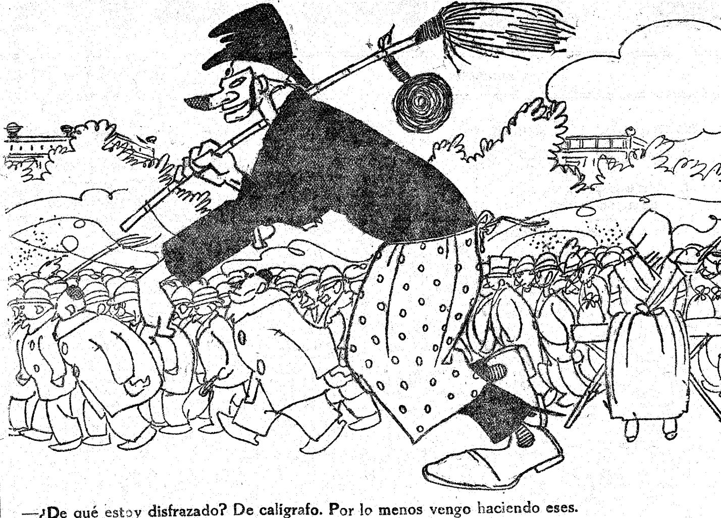
—¿De qué estoy disfrazado? De caligrafo. Por lo menos vengo haciendo esos.