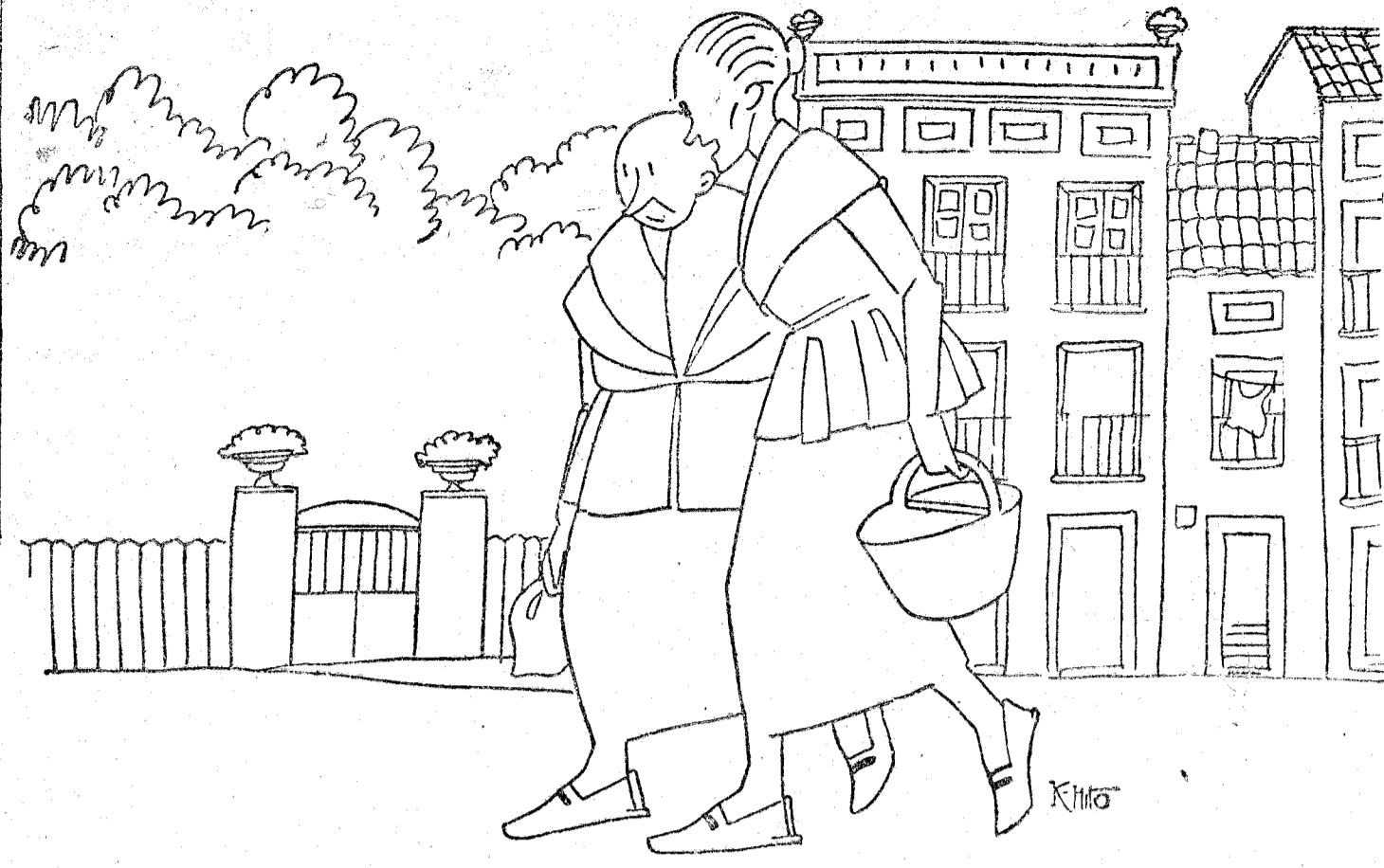
—Yo no me preocupo, señora Petra, porque tengo un pretendiente panadero y, caro, me hace la rosca.

el dictado terminante de católicos. Y, sin salir al extranjero, ¿no hemos visto ahora el ejemplo íntimamente confortador que nos ha dado la digna y benemérita clase escolar? Valiente, noblemente, al querer cimentar sobre base sólida su poderosa organización, ha comenzado su reciente Asamblea nacional, después de un día de retiro y una comunión general muy nutrida por afirmar la más rotunda profesionalidad.