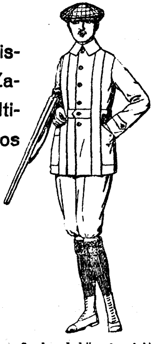
Cesadores de dril crudo o lino. De pesetas 16 a 30. Pantalones cortos para excursionistas, de dril, beige o gris. De pesetas 10 a 18.

Grandes existencias en Zapatería. Últimos modelos