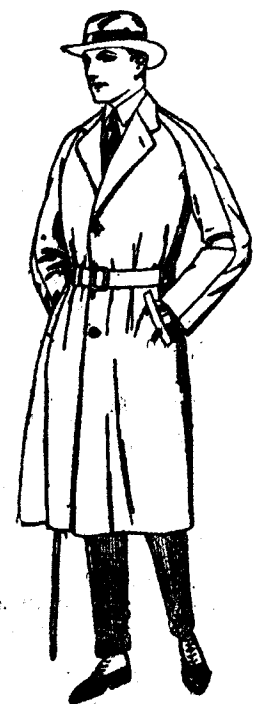
Gabanes de cheviot, melton, gabardina, etcétera. De pesetas 60 a 180.

SUCURSALES: Barcelona, Alicante, Almería, Cádiz, Bilbao, Cartagena, Gijón, Málaga, Palma de Mallorca, Granada, Santander, Sevilla, Valencia, Valladolid y Zaragoza