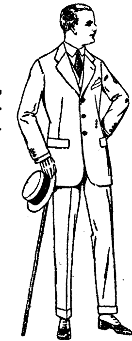
Trajes de lanilla, melton, etcétera, vicuña o jerga. De pesetas 35 a 145. Trajes de dril crudo, kaki o listado. De pesetas 25 a 60.

Trajes de vicuña o estambre azul para niños de tres a siete años. De pesetas 25 a 30. Los mismos de dril lino. De pesetas 10 a 15.