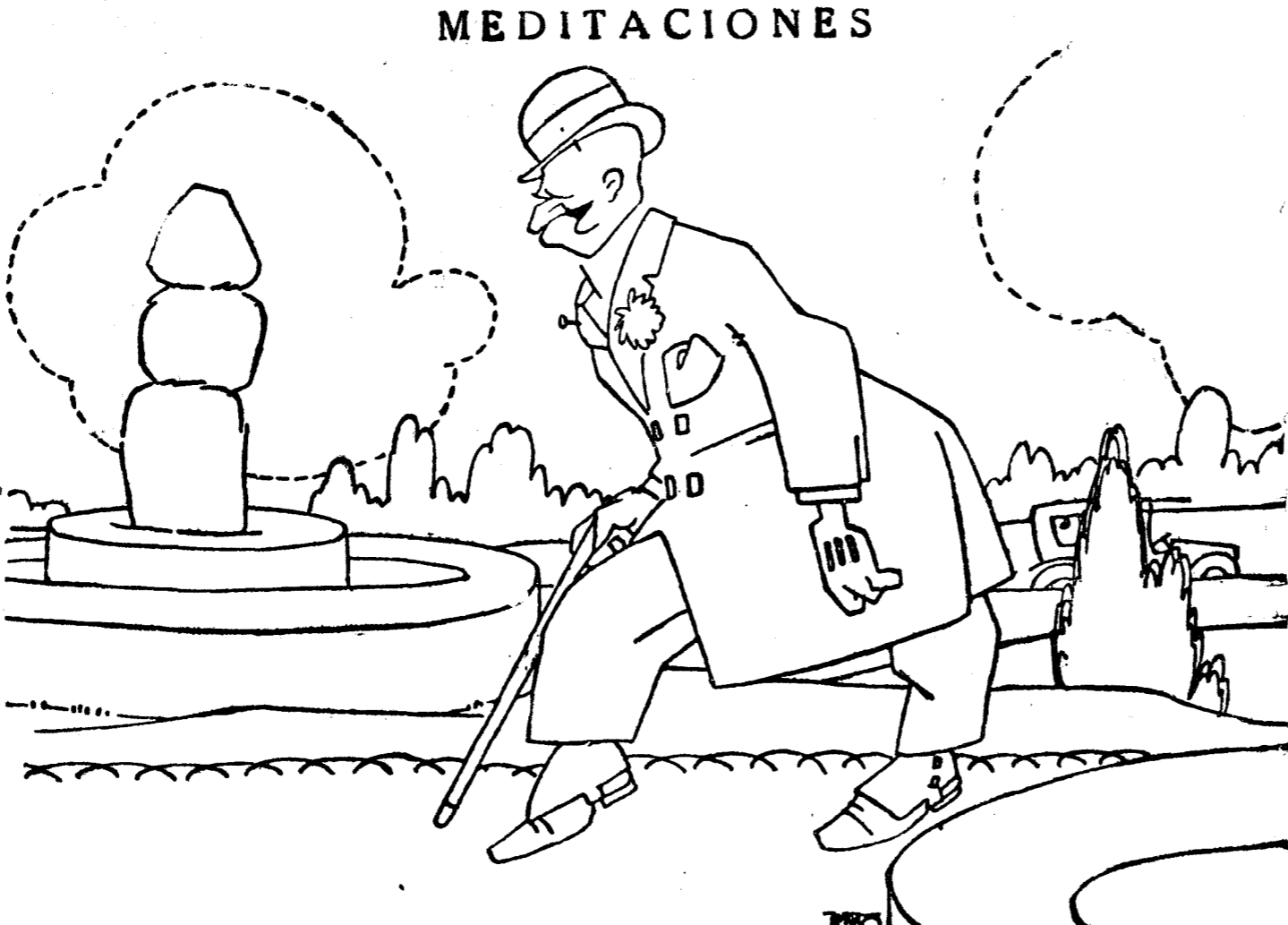
—Qué difícil va a ser sustituirme en Gracia y Justicia Porque puede que se encuentre un ministro de más Justicia; pero lo que es de más Gracia...

Entre las carrozas figuraba una muy artística del Ayuntamiento, que iba vacía, por el que habían ocupado los Reyes durante la fiesta. La carroza figuraba dos mujeres en un caso sosteniendo la corona, que venía