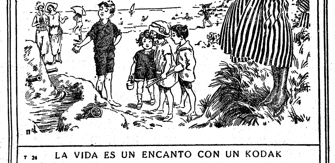
LA VIDA ES UN ENCANTO CON UN KODAK

Pida Catálogo ilustrado en caso de cualquier revendedor de artículos fotográficos, o a KODAK, S. A. MADRID: PUERTA DEL SOL, 4 GRAN VÍA, 25 BARCELONA: FERNANDO, 3 PASAD. DE GRACIA, 22 SEVILLA: PLAZA DE LA CAMPANA, 10