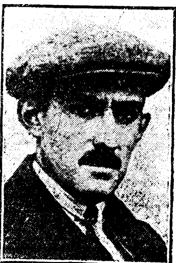
CONDE DE ZBOROWSKI, uno de los primeros "aseses" del volante, que se distinguió en las carreras del autódromo de Sitges.