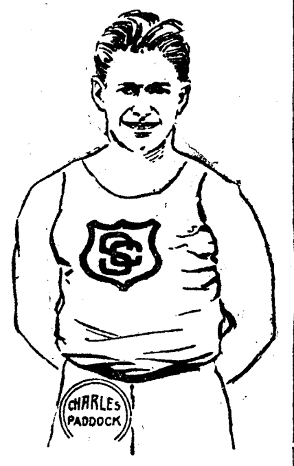
CHARLES W. PADDOCK