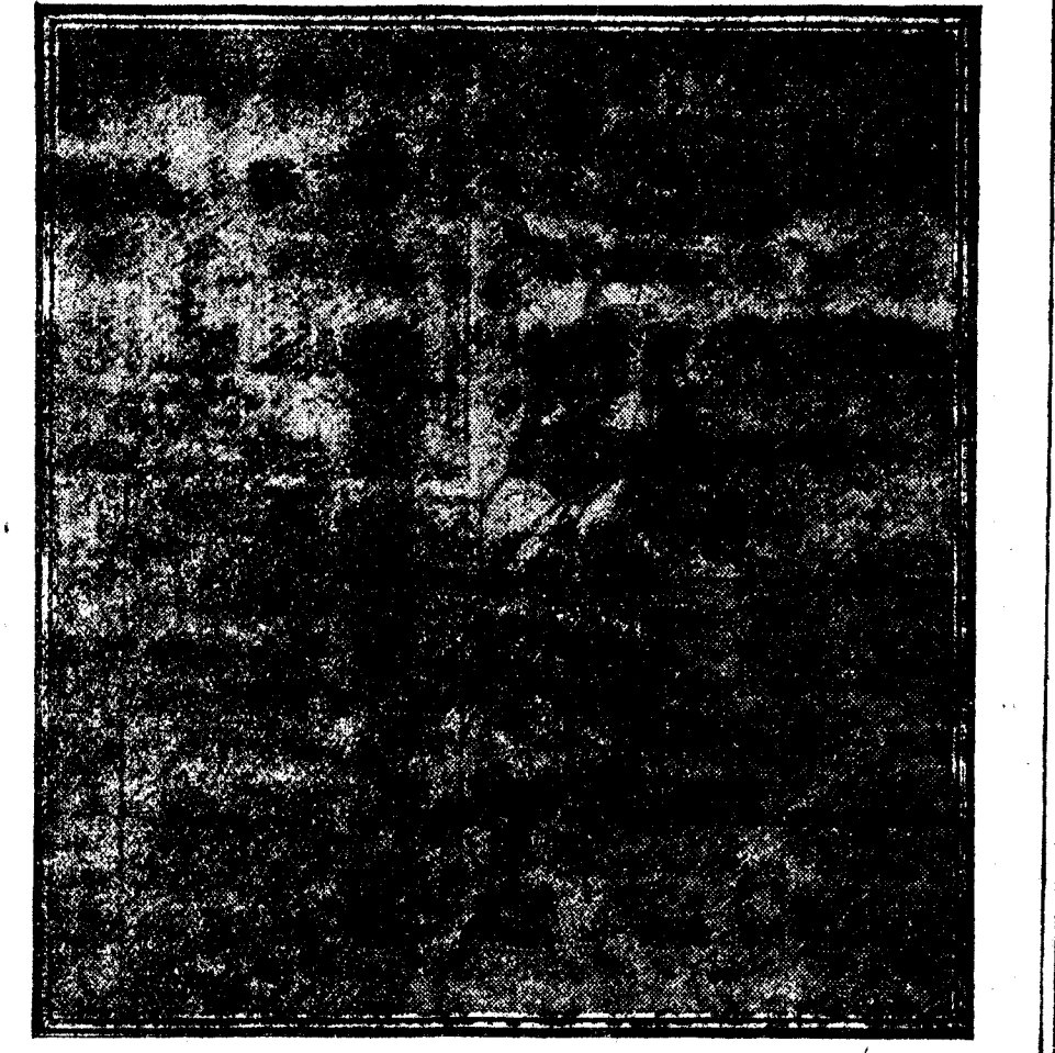
SU MAJESTAD EL REY, JUGANDO AL POLO