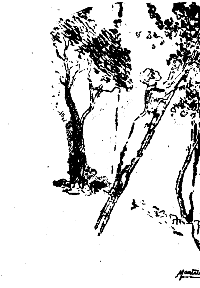
...subida en lo alto de una escalera...