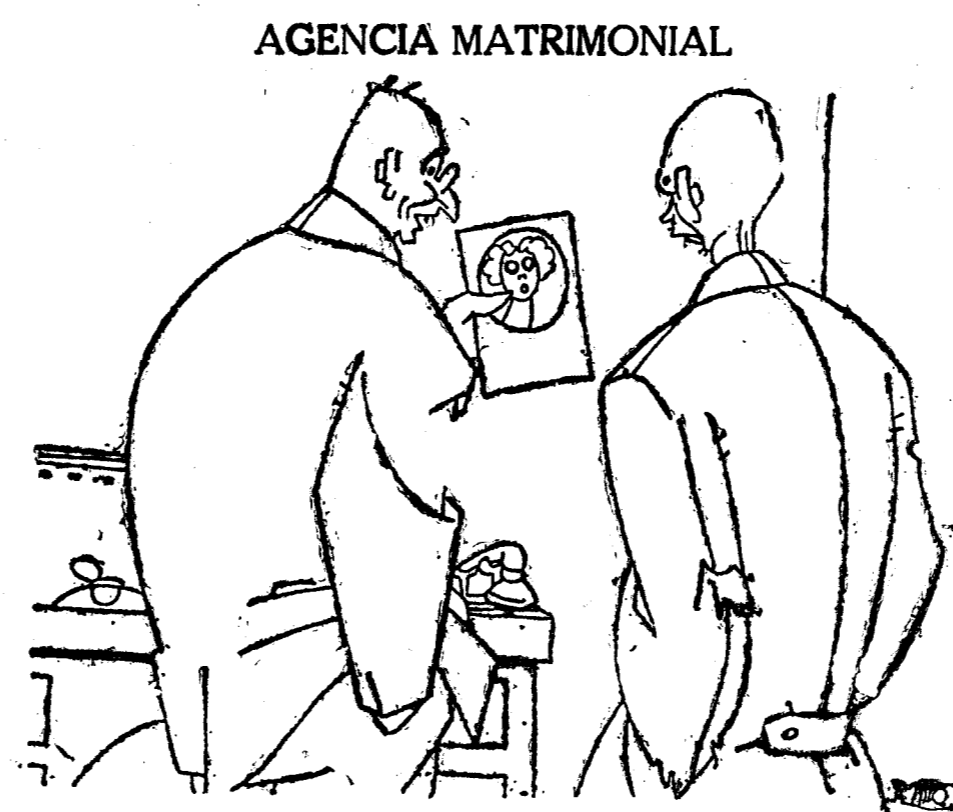
—Esta es una señorita parisiense tres veces divorciada por no guardar fidelidad a sus esposos; pero tiene una gran fortuna... —¡Ah! Bien, bien. —Digo que tiene una gran fortuna, porque no hubo uno que le rompiera la cabeza.

En la planta baja del Museo de Arte Moderno se inauguró ayer, con asistencia del señor Silió y presencias de numerosas representaciones oficiales y de Centros artísticos y de cultura, la Exposición del monumento a los héroes de Tarragona, que es una de las obras más notables del malogrado artista. La madre de éste recibió la felicitación, comovida, de cuantas personalidades asistieron al acto.