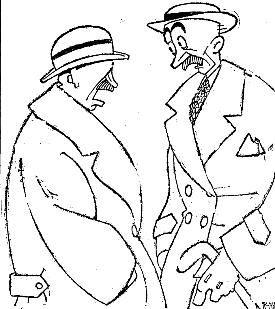
—¿Qué pasa, hombre? ¿Qué ocurre? ¿Qué sucede? —Agárrate, chico. Una cosa horrible. ¡Durante las últimas veinticuatro horas no se ha celebrado ningún nuevo banquete!